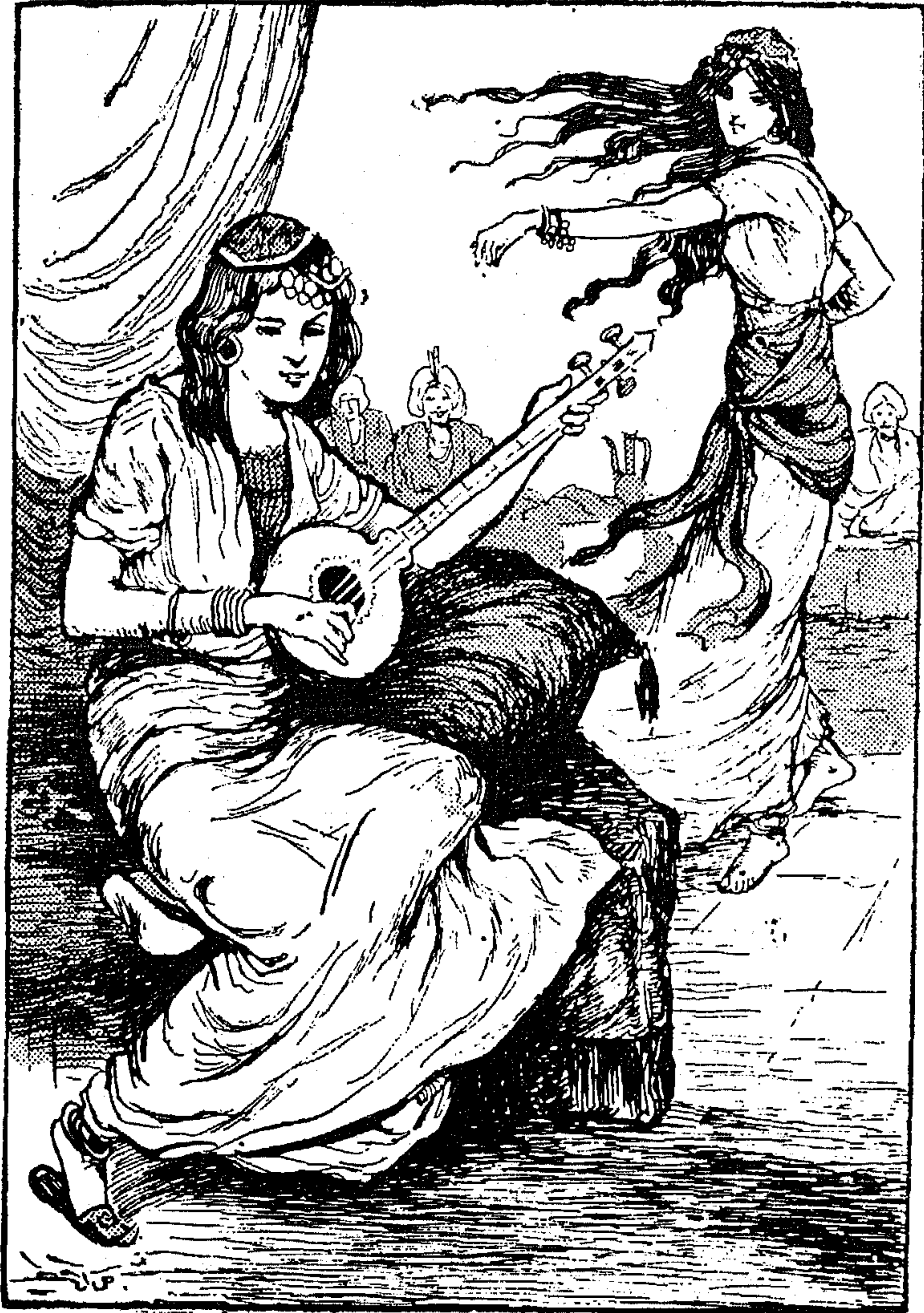
« وبعد برهة ، أقبلت جارية تفتن الناظرين ، يظهر من ملامحها أنها كرجية الاصل ، دخلت المصطبة نافرة كأنها الغزال انفلت من شبكة الصياد»