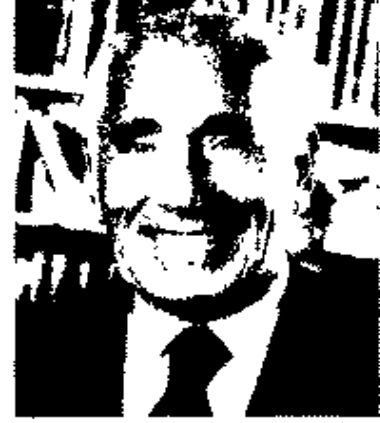
محمد حسنين هيكل