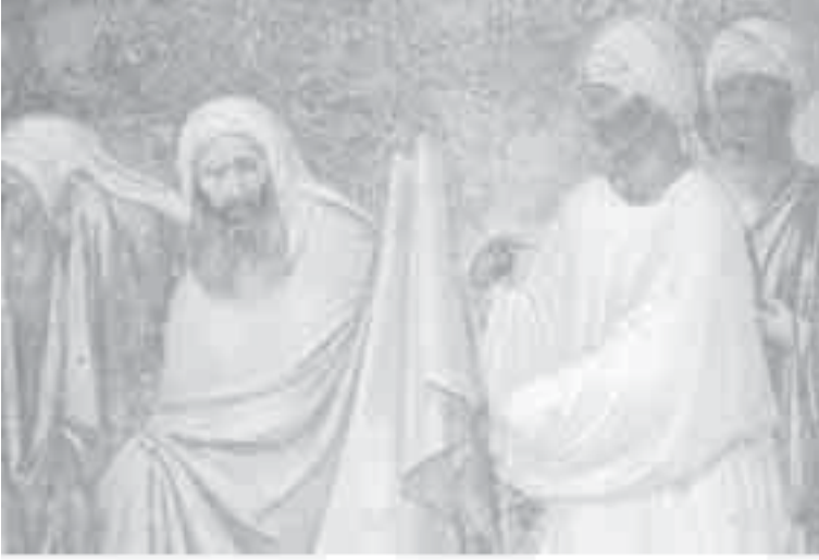
2- غيوتو، جدارية الاختبار بالنار.