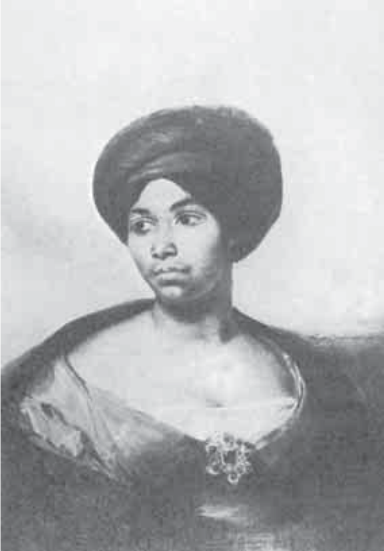
11- ديلاكروا امرأة بالعمامة الزرقاء.