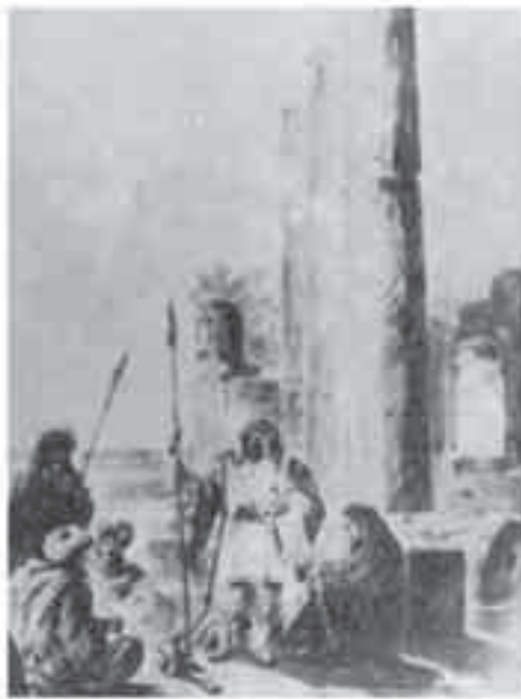
2- فوربان، عرب فوق خرائب عسقلان.