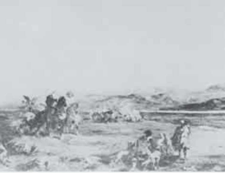
3- فرومنتان , صيد الإبل.