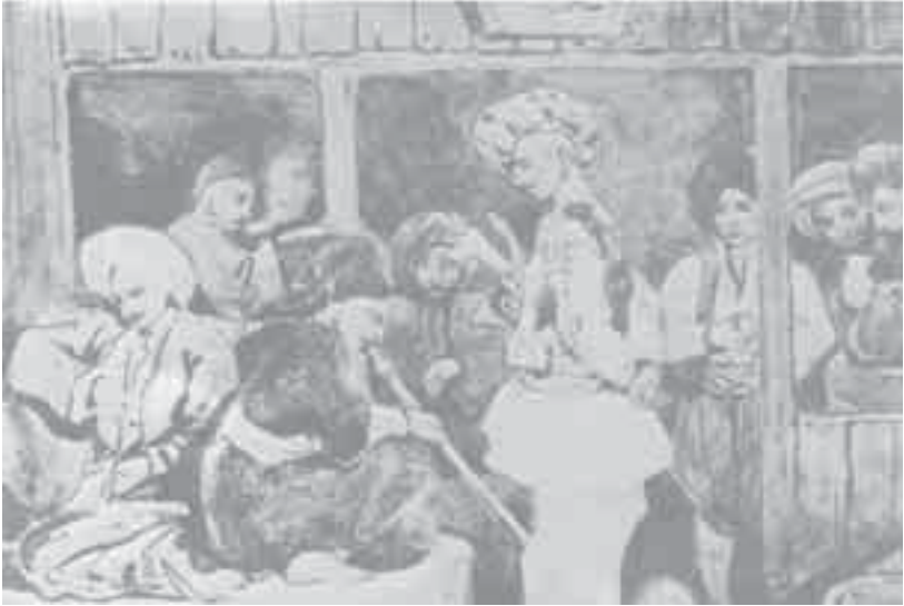
9- شارمتان، مقهى تركي.