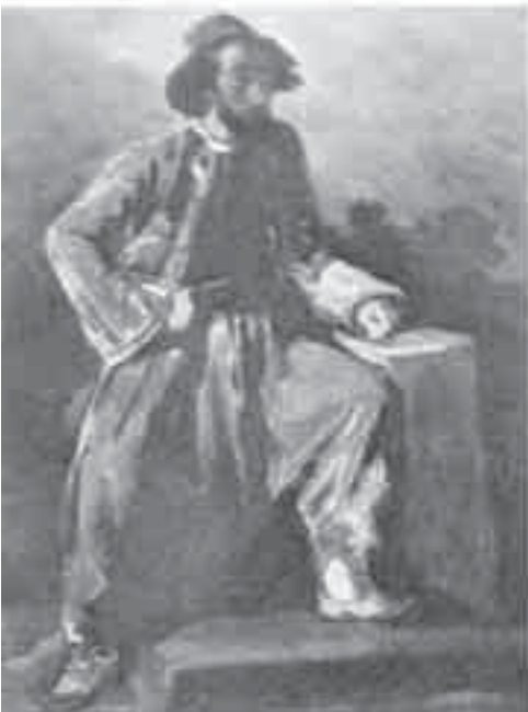
26- ديلاكروا، بورتريه باريوليه.