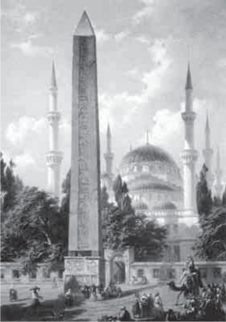
48- فلاندين و عامود هييون في القسطنطينية.