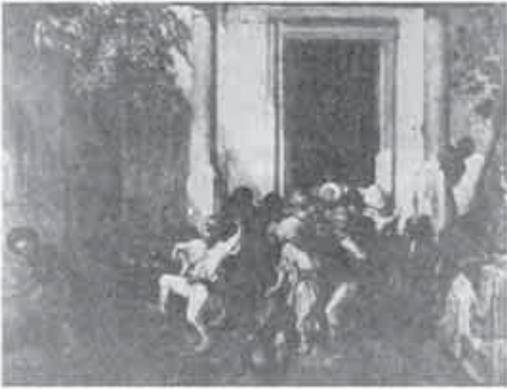
1- ديكان، الخروج من المدرسة التركية.