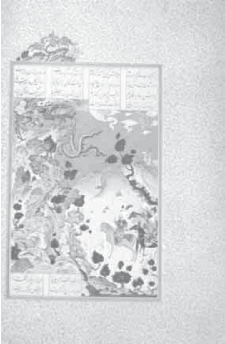
11- منمنمة إسلامية: رحلة مساما في جبل الدروز.