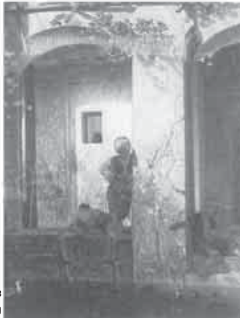
28- ديدبان، أطفال أترك قرب النافورة.