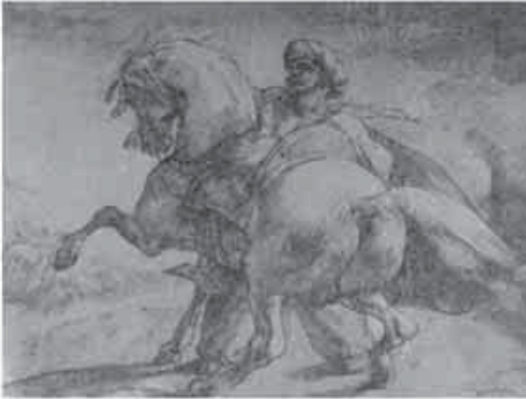
3- جيريكوو، فارس تركي.