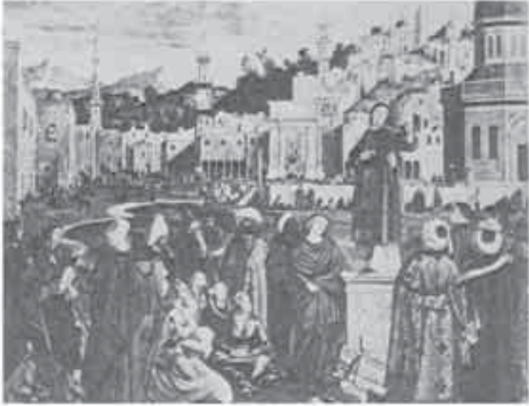
3- كاريكاتشو، تاريخ القديس اسطفان.