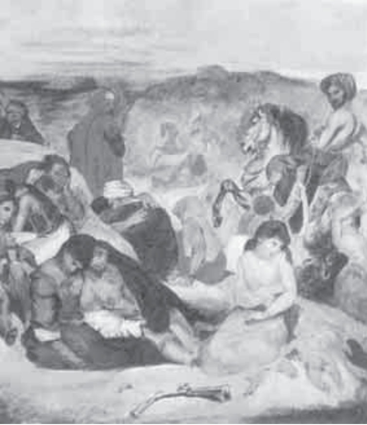
17- ديلاكروا، لوحة تمهيدية لمذبحة هيوس.