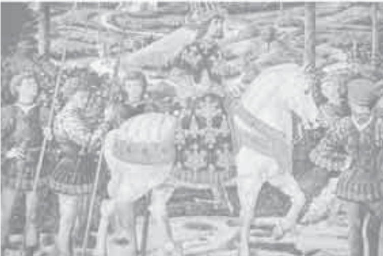
3- غوزولي، مشهد من سجود المجوس.