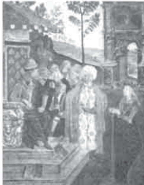
6- بنتوروكيو, تاريخ القديسة بريارة.