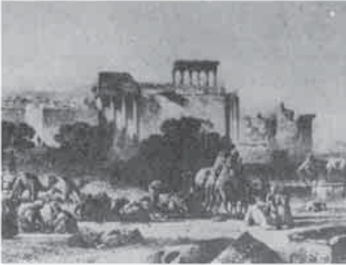
7- ماريلا: استراحة القافلة عند خرائب بعلبك.