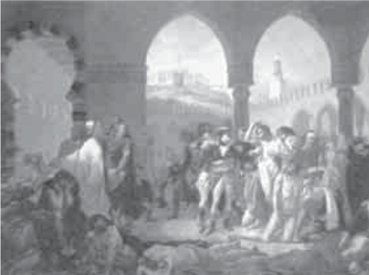
13- غرو، بوناپرت يزور مرضى الطاعون في يافا.