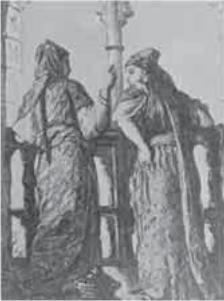
2- شاسريو، مغربيتان.