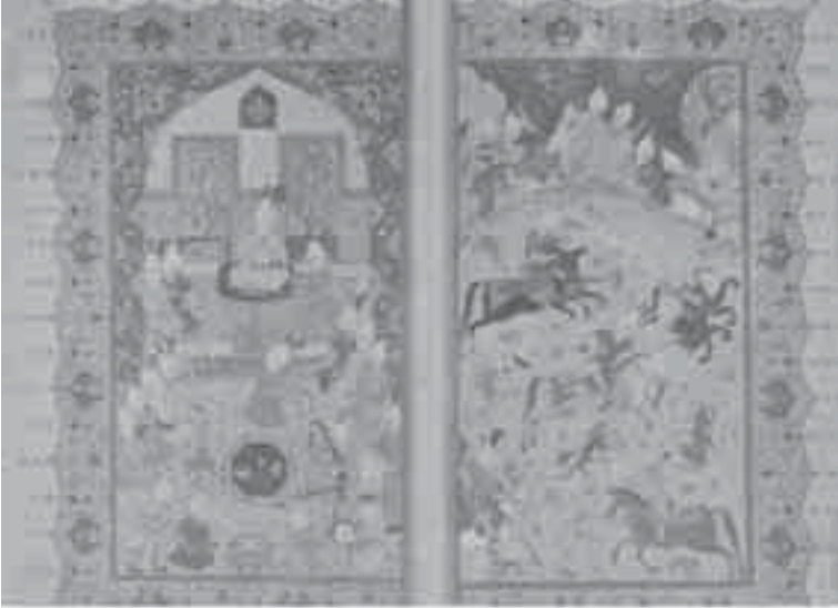
5- منمنمة إسلامية: رقص وغناء وحفل صيد.