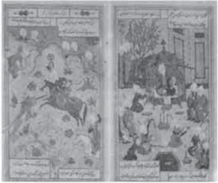
7- ممثلة إسلامية: من ديوان علي شير نوائي.