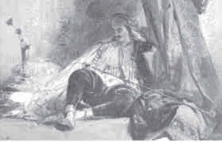
25- بونتغون، تركي في لحظة استجمام.