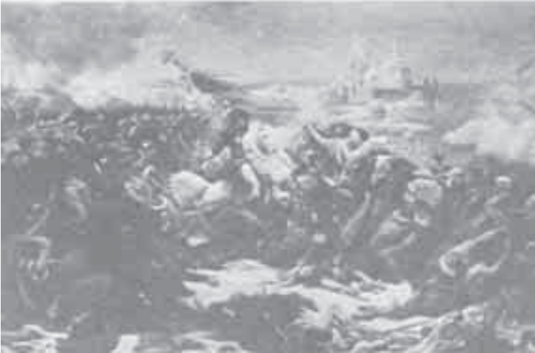
8- غزو، معركة أبو قير.