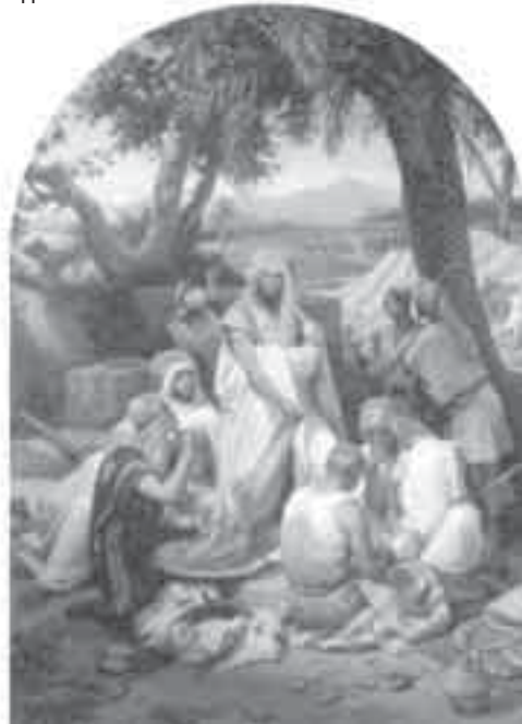
45- فرنيه, ثياب يوسف.