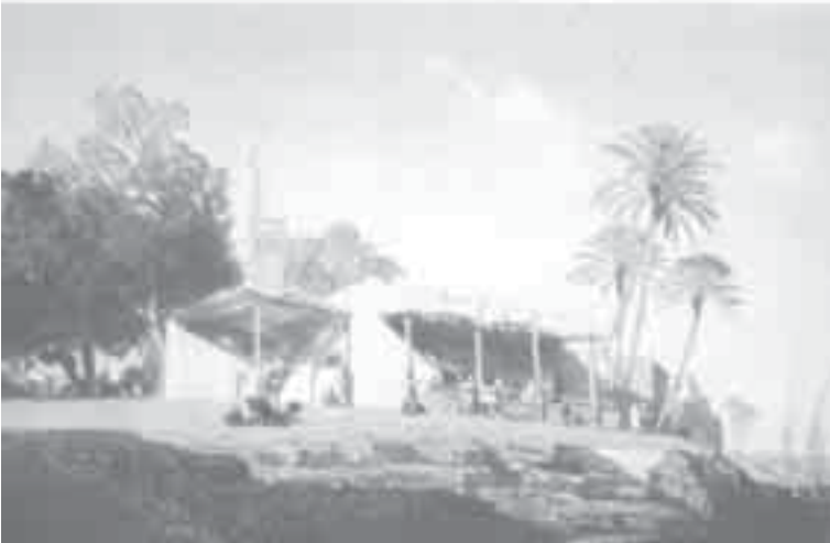
40- ماريلا، بني سويف على النيل.