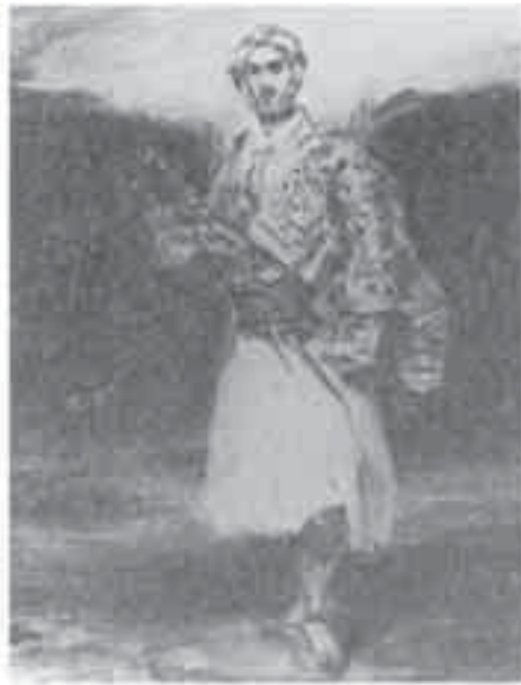
2- ديلاكروا، الكونت بالتيانو.