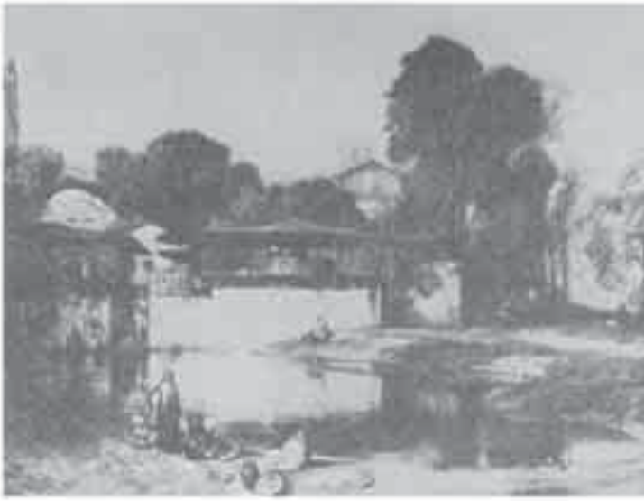
3- ديكان, منظر طبيعي تركي.