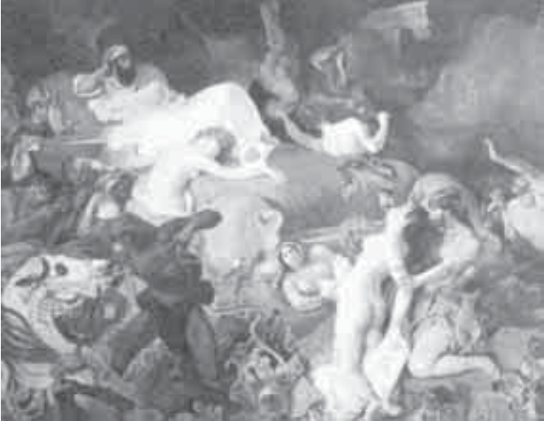
18- ديلاكروا، موت سردانابال.