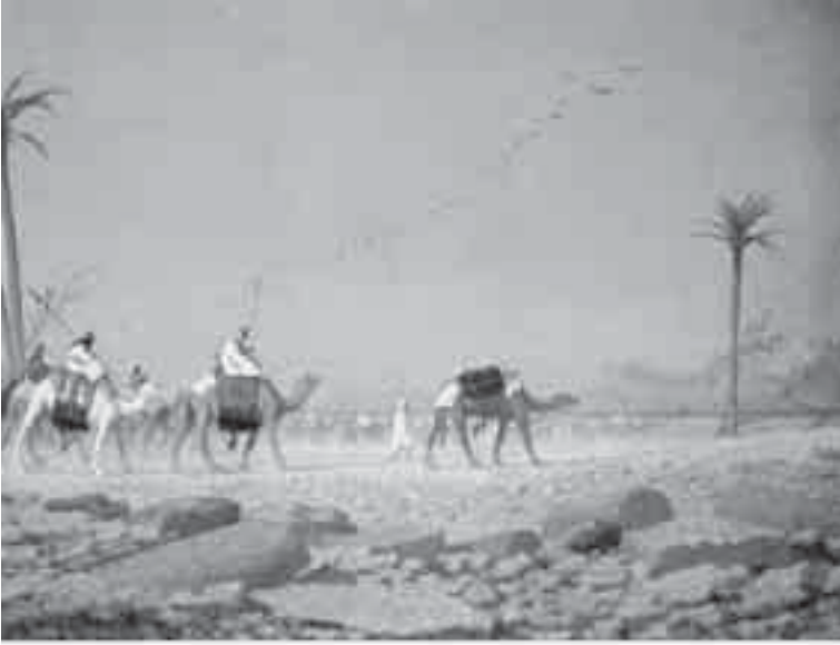
49- فريير، قافلة الصحراء.