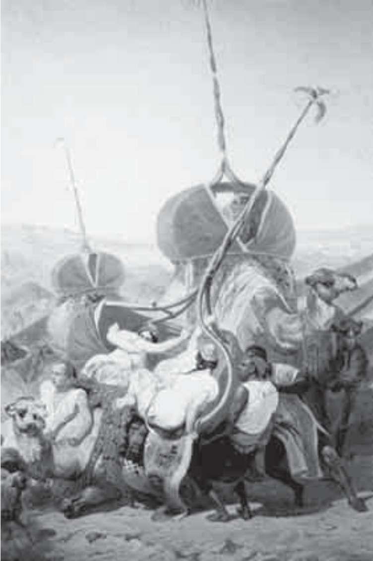
46- فرنیه، الاستیلاء شمالاً عبد القادر.