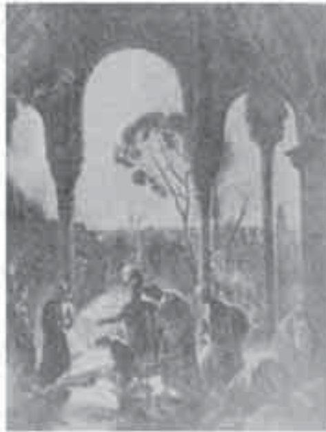
4- فوربان، الاستيلاء على قصر الحمراء في غرناطة.