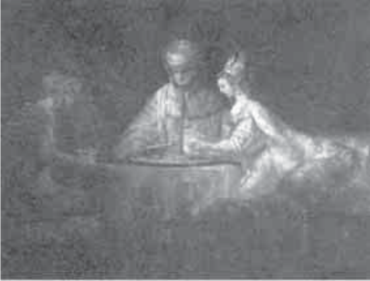
5- رمبرانت, أمان وأزفير.