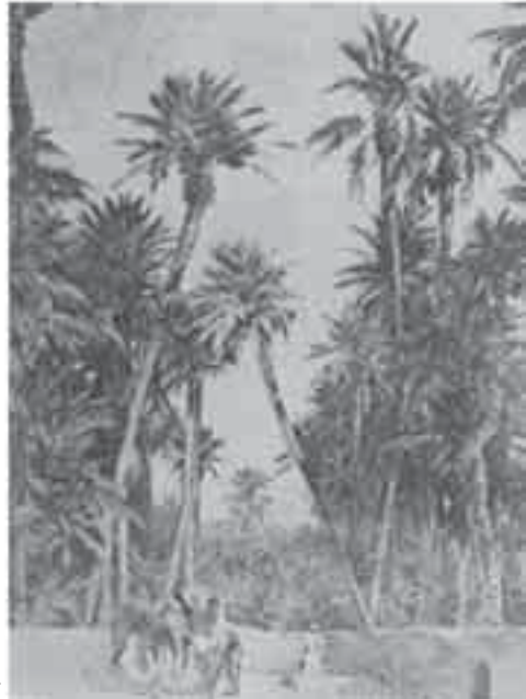
4- فرومنتان, غابة النخيل.