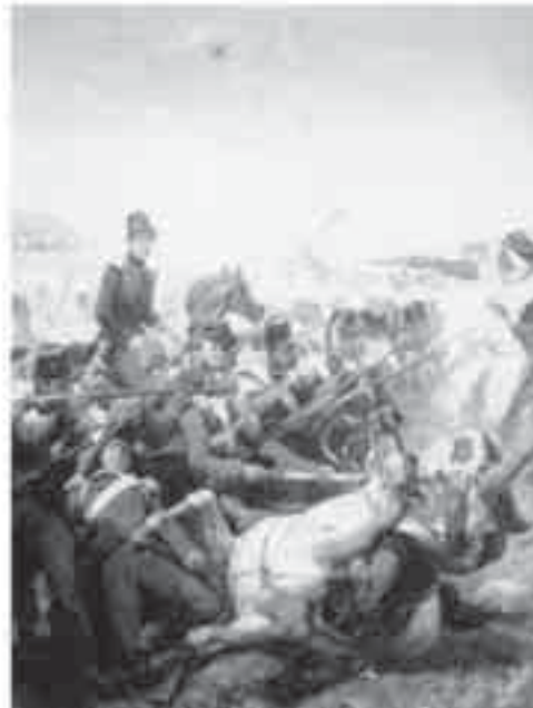
50- فرنیه، معركة سماح.