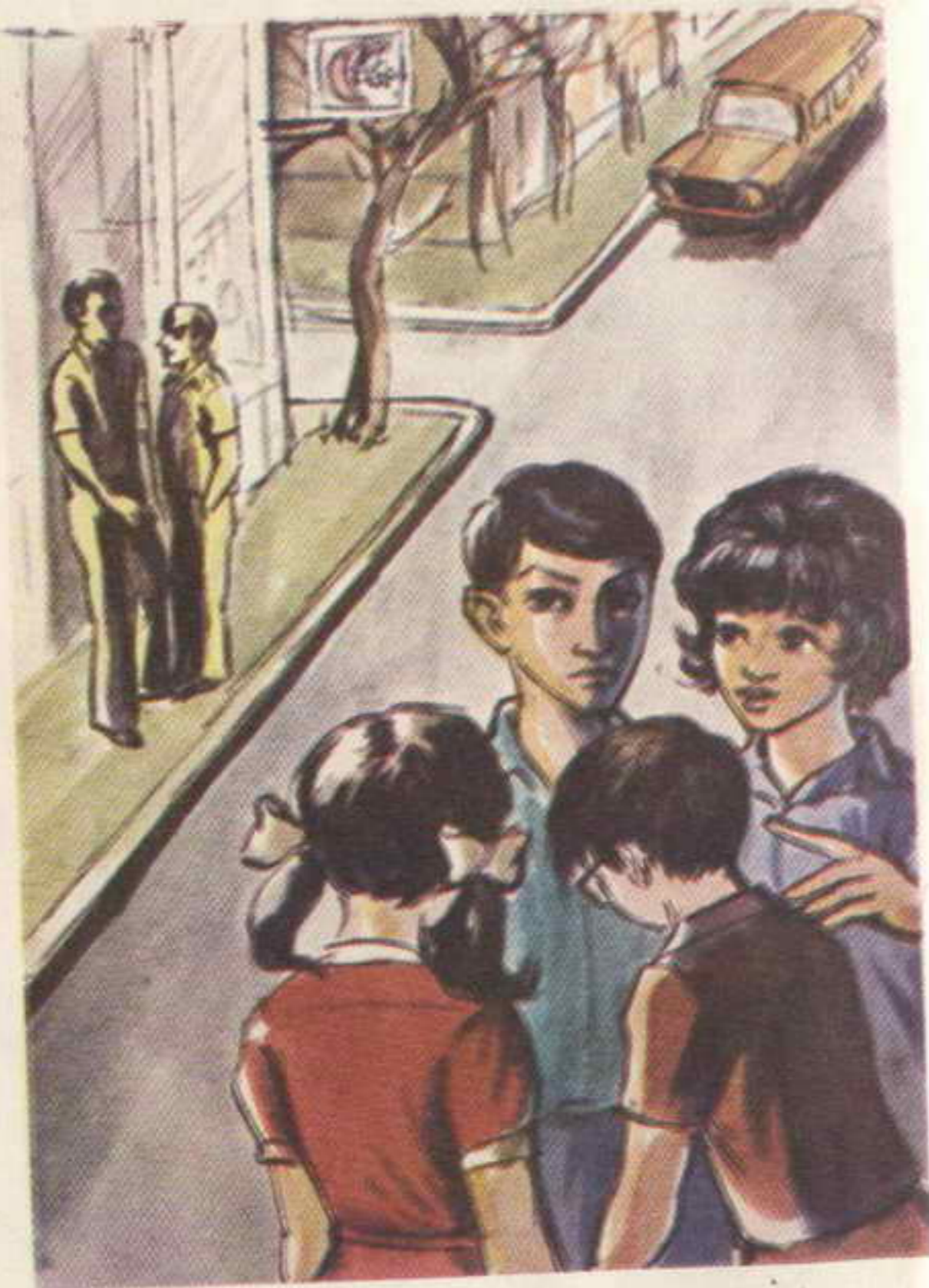
بفجأة همست « فلفل » انظروا . الرجلان اللذان ترتاب فيهما

الرجل : إنني أريد زيارتها لخمس دقائق فقط حتى أطمئن عليها .