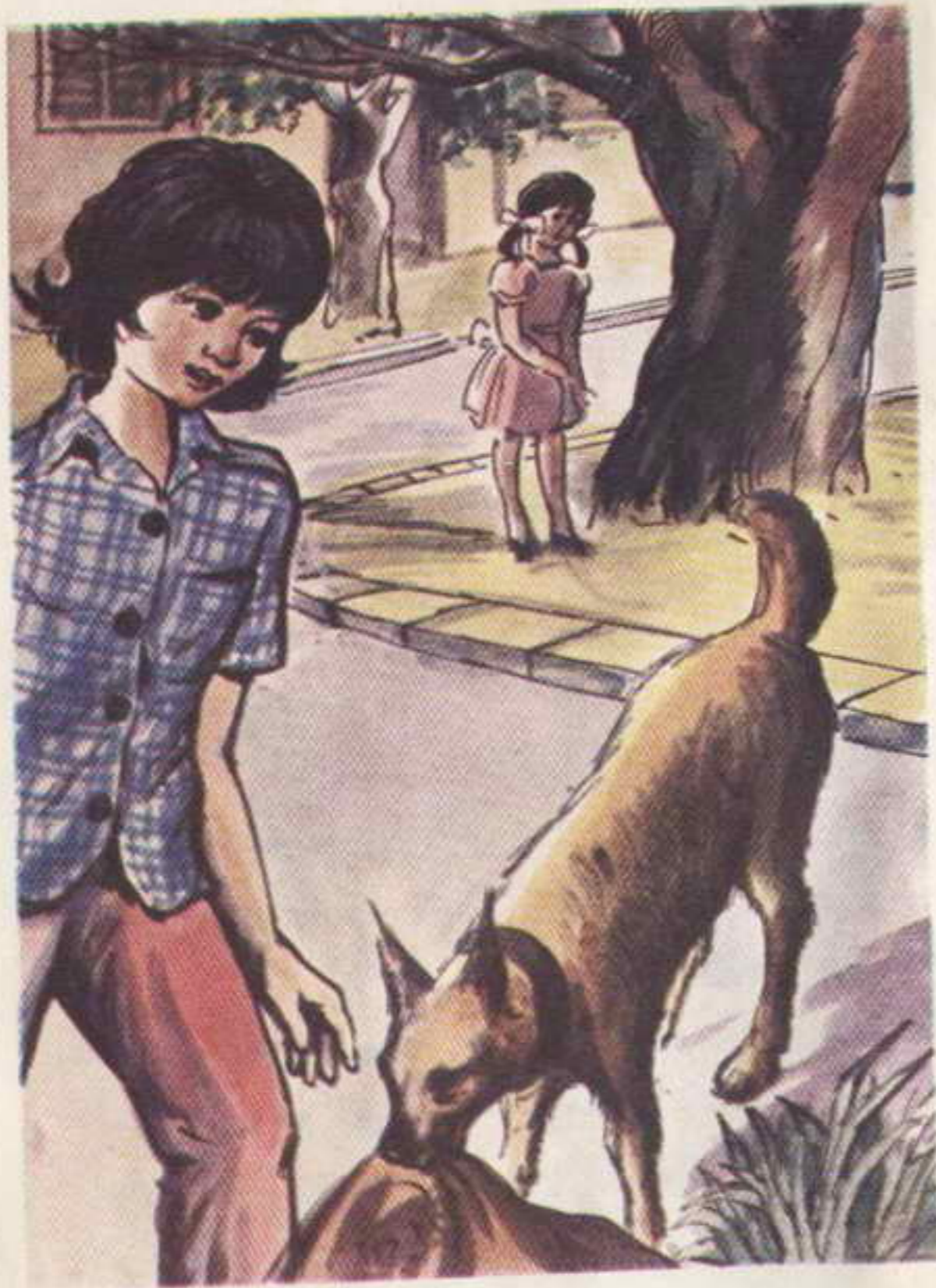
كان « فهد » مطلقاً بأسنانه على قطعة من قماش حريري

فراحت تنهره قائلة : ألق بهذه القاذورات يا « فهد » اتركها في الحال .