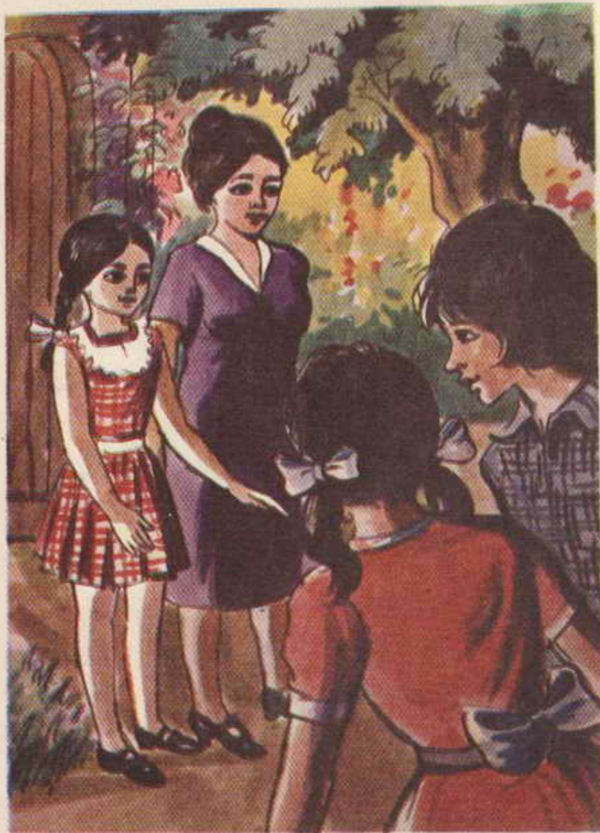
وجهت الفتاتان لاصطحاب « تاجو » والسيدة « بواكو » إلى نادى الصيد

البواب : لحظة واحدة من فضلك . ما اسمكما ؟ حتى أبلغ أهل البيت .