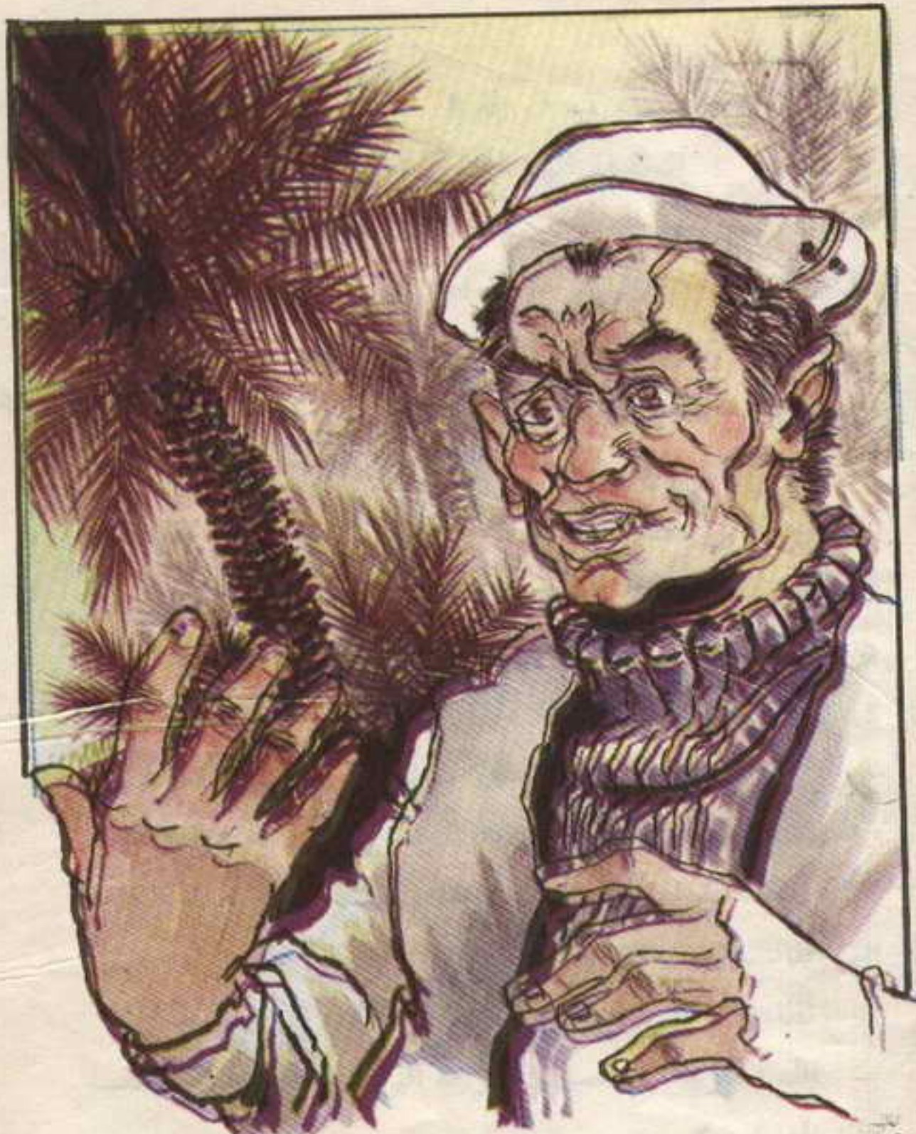
مدّ « زنهار » يده إليها بطريقة فهمتها على الفور . . . كان واضحاً أنه يطلب منها الورقة .

أحكى لكم كل ما حدث بعد خروجكم للصيد وبقائى فى غرفة المكتبة .