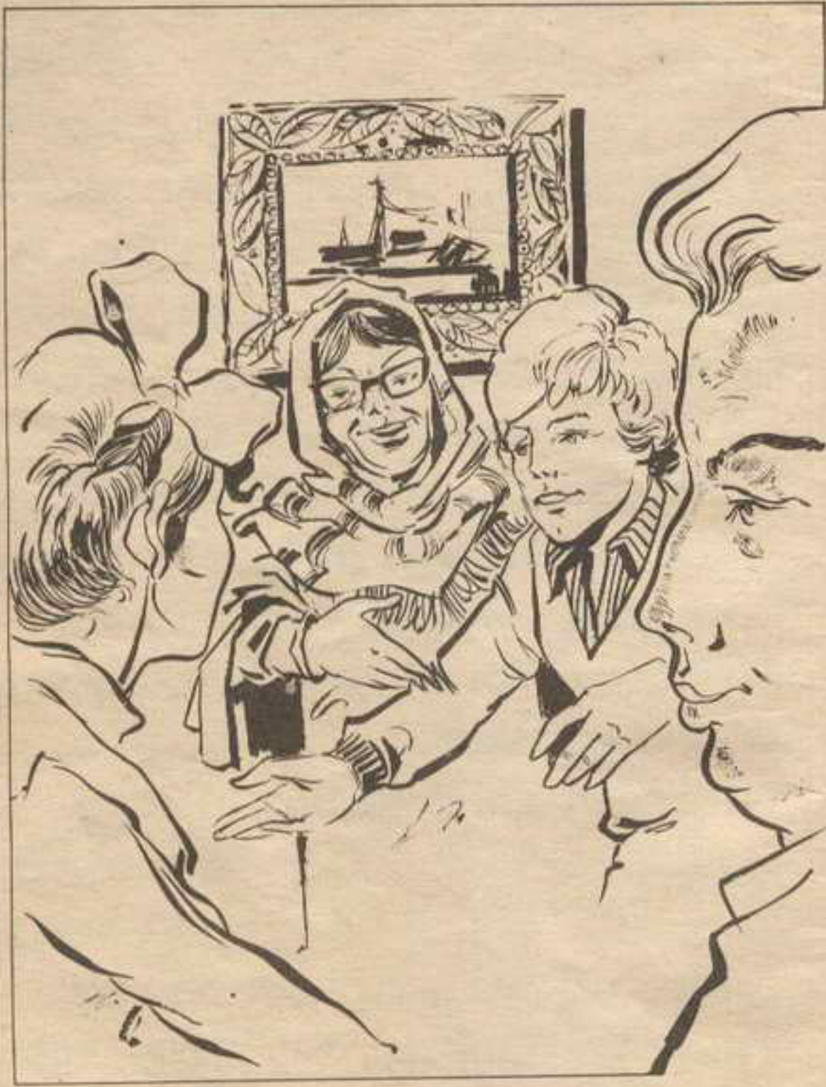
ظهرت إلى جانب «عماد» سيدة يتراوح عمرها بين الخمسين والخامسة والخمسين .

تدرجياً . . وبعد نحو ساعة من السير البطيء . . وصلوا إلى ساحة رملية . . تبرز فيها صخور ضخمة . . وفي ركن من الساحة التي تشبه الجزيرة . . كانت مزرعة الرياح . . بناء ضخم لا تبدو تفاصيله واضحة في الظلام ، مبنى من الحجر والصخر . . يبدو كقلعة من قلاع القرون الوسطى . . وقد ارتفعت فوق تل من الصخور الضخمة . . التي كانت الأمواج العالية تنكسر عليها في وحشية . . وعلى مبعده نحو مائة متر منها كان ثمة مبنى أصغر حجماً . . يشبه فيلا صغيرة . .