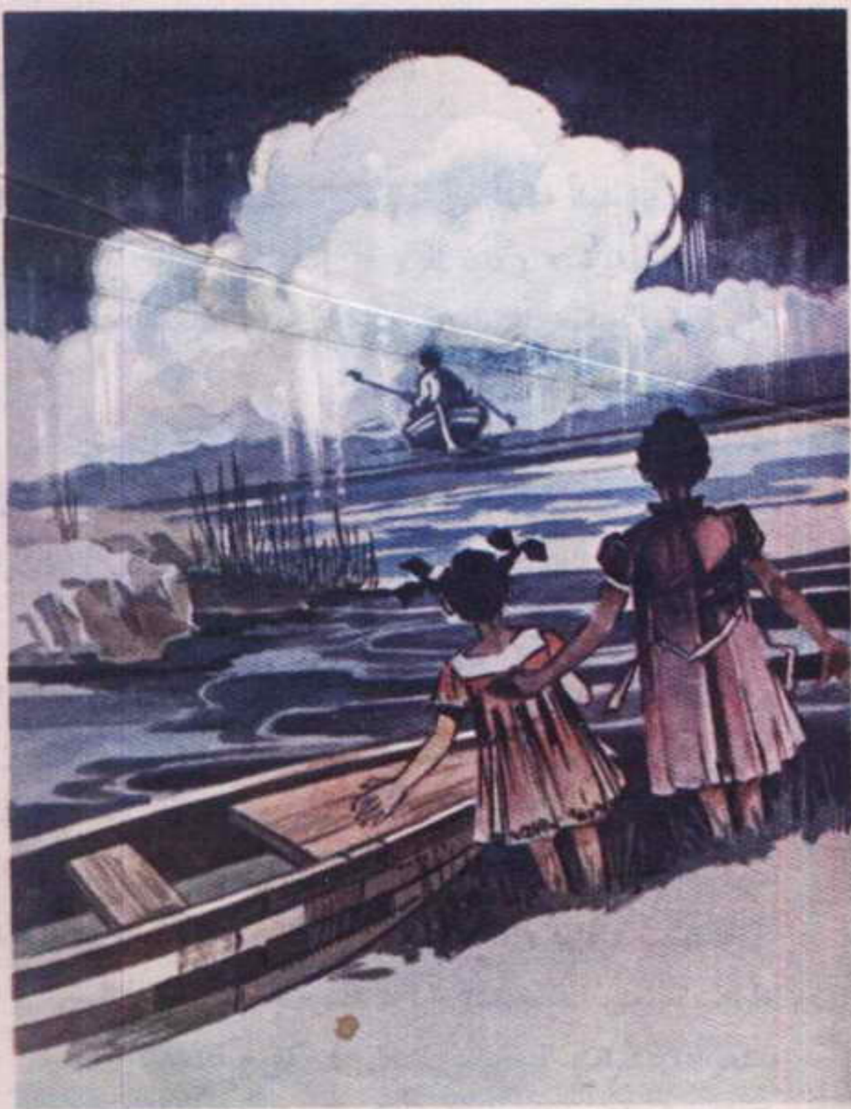
وقفت «نوسة» و«لوزة» على الشاطئ... ومن بعيد ظهرت سحابة الضباب الضخمة

أخذ «محب» و «عاطف» يجدفان والضباب تزايد كثافة . . وفجأة دوى في الصمت صوت هدير بعيد ، أخذ يتزايد شيئاً فشيئاً ، ثم ظهر في قلب الضباب الكثيف ضوء أصفر كاشف يشق الضباب في خط مستقيم . .