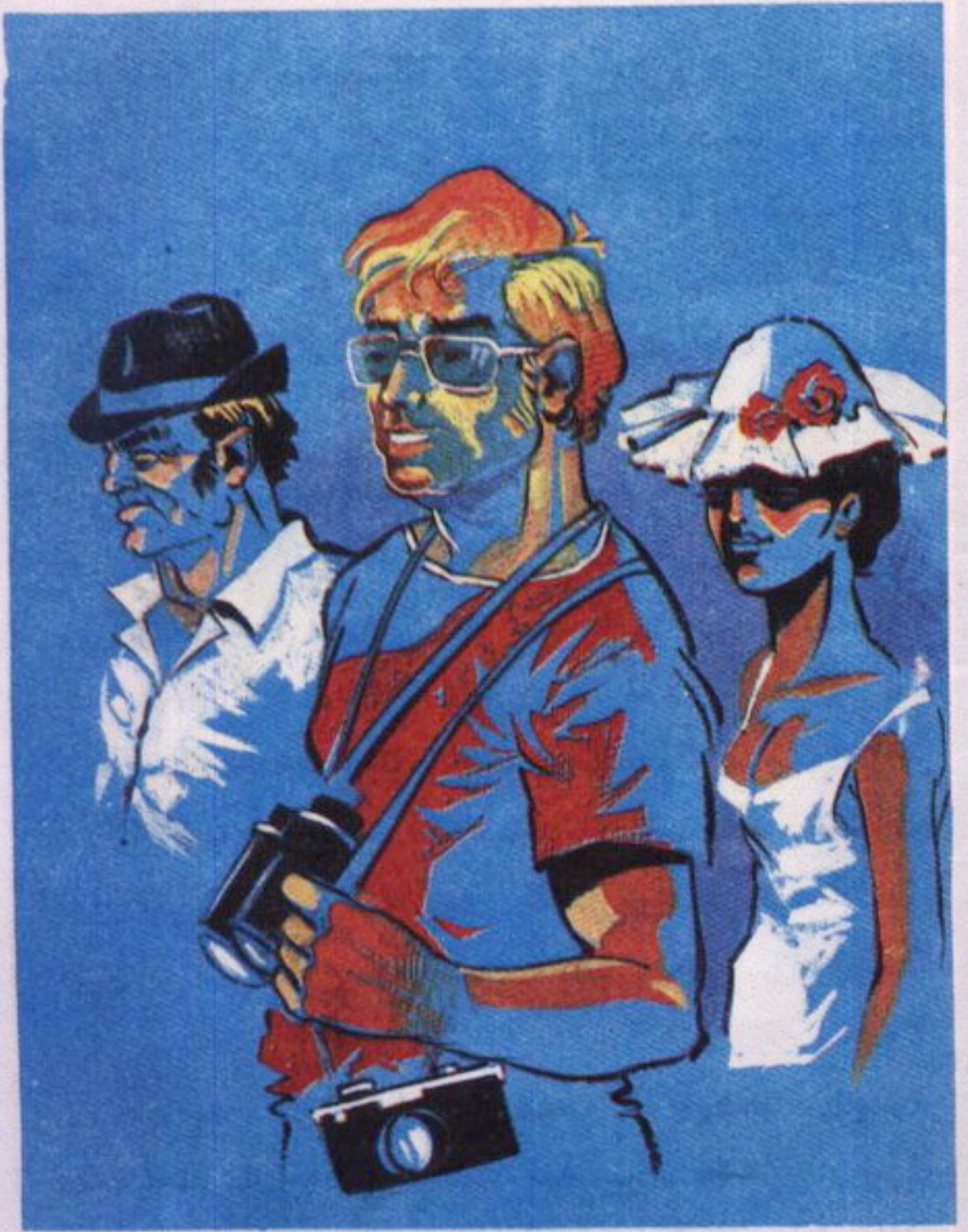
ظهر الأمريكي ومعه رجل آخر وسيدة.