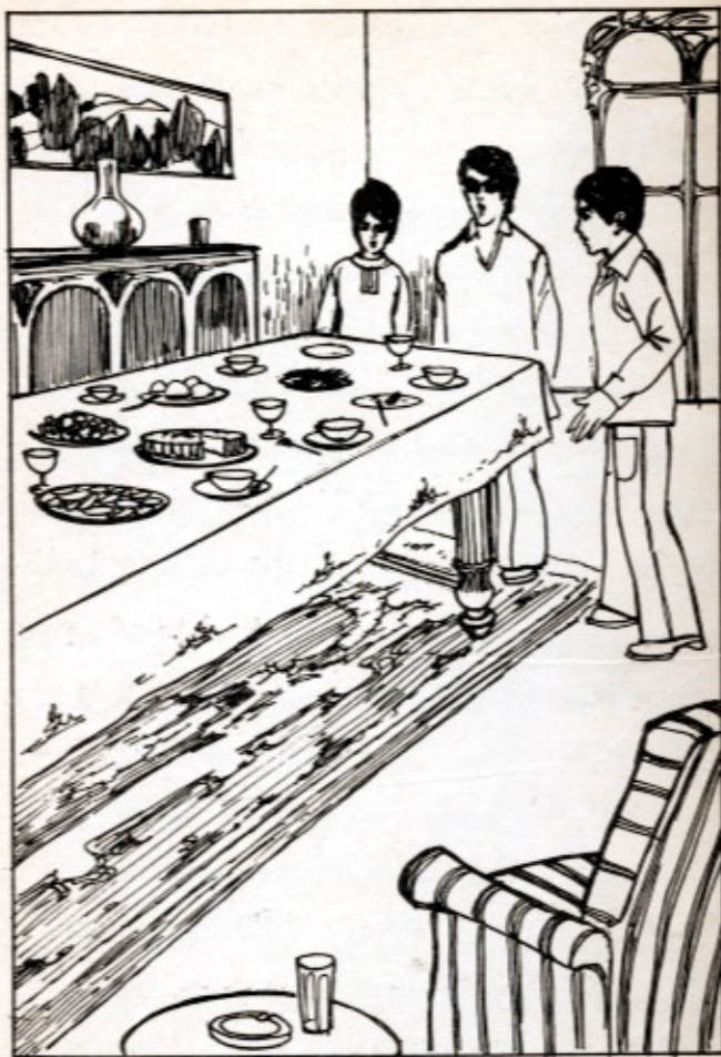
دار المغامرون حول المائدة .. وفجأة صاح « ممدوح » : أني .. أني ..

عال وكأنه يطمئن نفسه ليشعر بوجوده : غريبة ، هل حدث عطل مفاجئ للكهرباء في القصر ؟