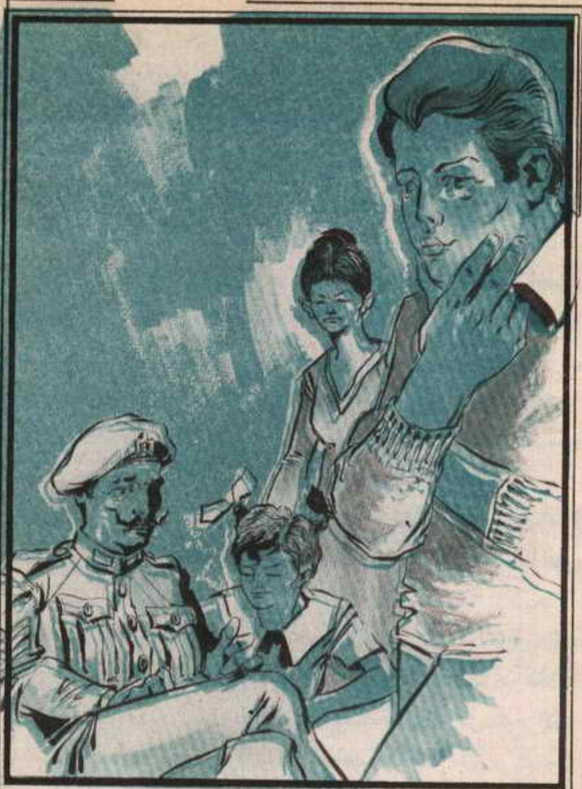
قال الشاويش بصوت حزين: ألم يظهر «عاطف» بعد؟

لا تقومون بإحدى مغامراتكم الغريبة؟ تختخ: إننا لا يمكن أن نخفي عنك هذا. فإن غياب «عاطف» يقلقنا جدًا. وبالمناسبة هل استجوبتم الشغالة التي تعمل عند «حزاوي»؟!؟