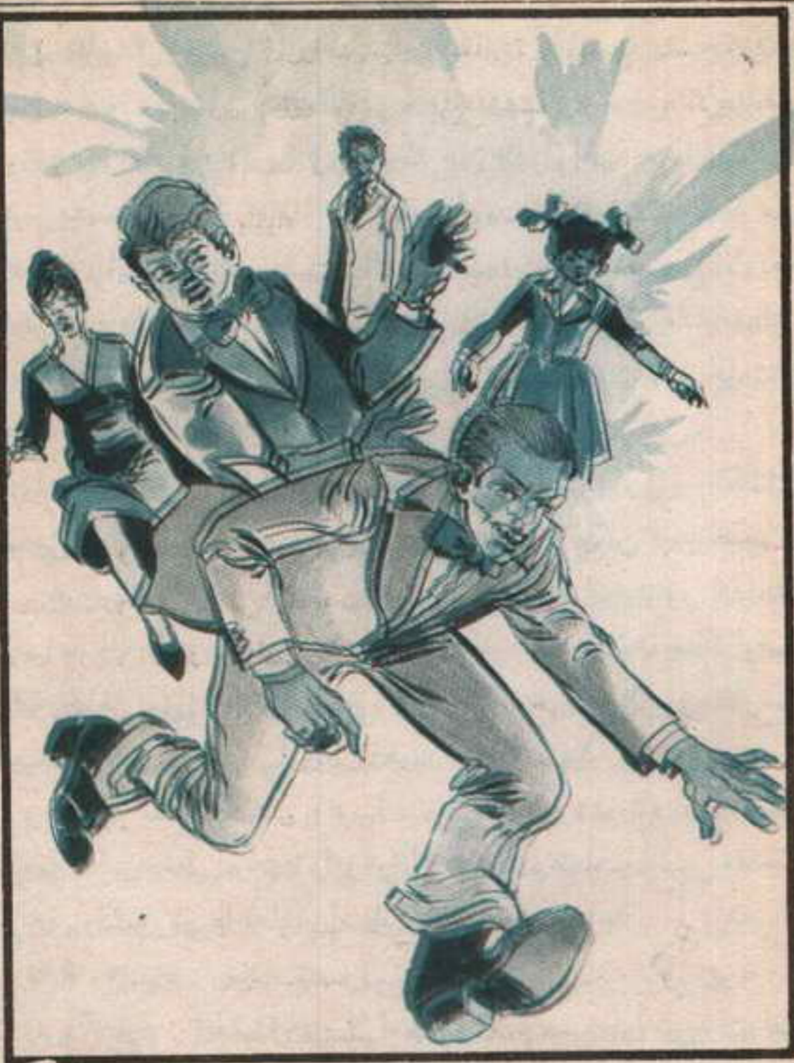
جرى «محب» إلى الكشك ، وسرعان ما انضم إليه الباقون

ابتسم «محب» قائلاً: إنها بالتأكيد إحدى مفاجآت «عاطف» فلا بد أنه سيظهر فجأة ومعه شيء ما.. أو في ملابس غريبة! اطمأن الجميع إلى هذا التفسير عدا «تختخ» الذي أخذ يفكر فيما حدث.. هل كانت الصواريخ مفاجأة «عاطف»؟! فإذا كانت