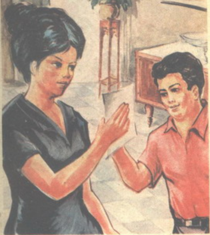
وأخذ «تختخ» يحاور السيدة حواراً غامضاً ، و«تحتج» يستمع

هز الشاويش رأسه موافقاً ففضى "تختخ" يقول : وكان حجمه صغيراً . . ولم يبك ولم يضحك ولم يتحدث !! مرة أخرى هز الشاويش رأسه موافقاً ففضى "تختخ" يقول : ولم تطلب السيدة طعاماً له . .