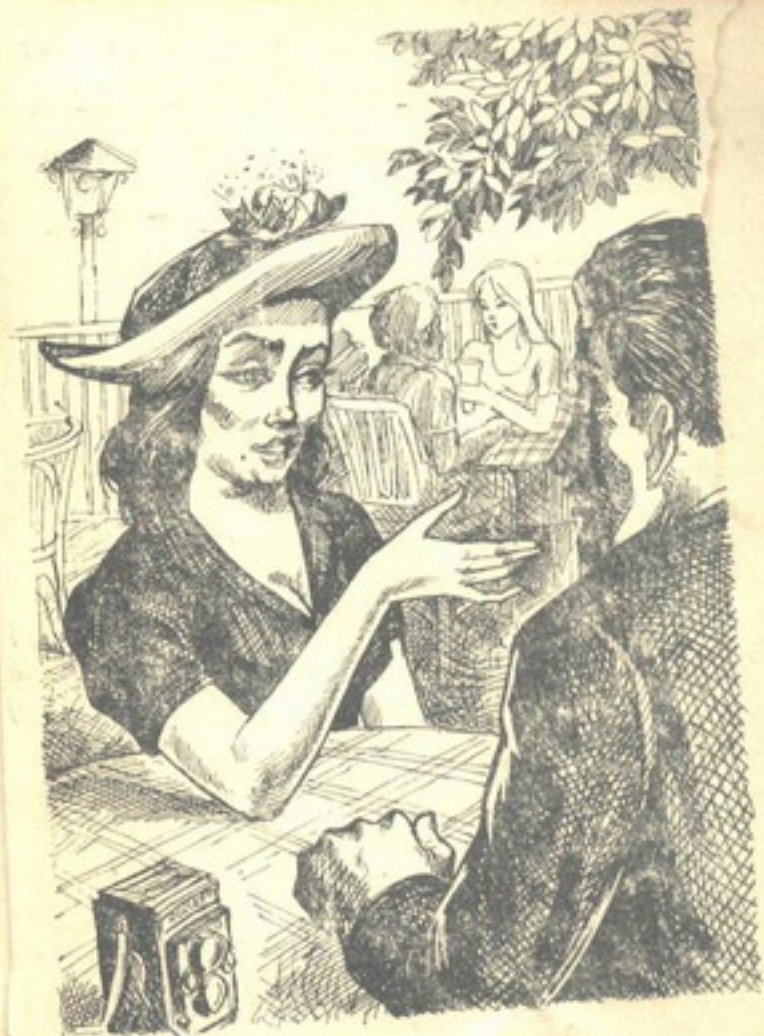
وجلس ضابط المباحث مع السيدة في الكازينو يستمع لما حدث .

الضابط : والعمال الذين كانوا عنده ، هل كان بينه