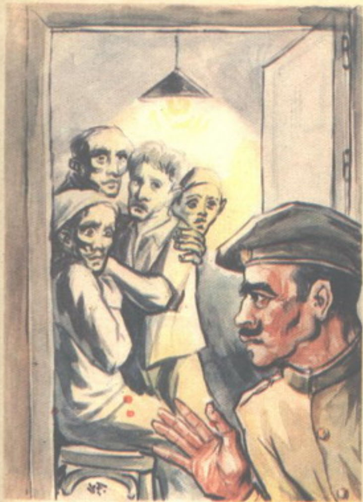
وفتح الشاويش الباب ووجد الرجال الأربعة ينظرون إليه في خوف

التليفونات وأخذ يقلب فيه ، وهو يستخرج منه أرقاماً ثم وضع الدليل جانباً عندما انتهى "عاطف" من حكايته . .