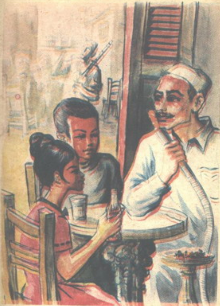
وجلس « محب » و « نومة » مع السمسار يتحدثان عن الشقة وساكنها

إن هذه السيدة ليست غريبة تماماً عني ! أمسك الأصدقاء أنفاسهم . . وقال « تختخ » : هل تعرفينها ؟