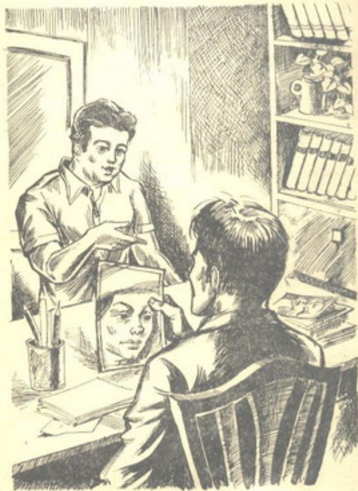
وأعد الصحنى بشرح «تختخ» قصة مثلة الكومبارس التى فشلت

فى السابعة اجتمع المغامرون الخمسة ومعهم الشاوش «فرقع»