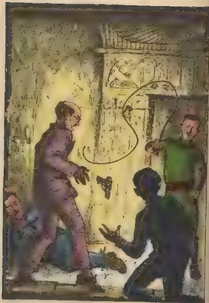
ومحاجة دوت فرقة عالية . . وطار المسلسل عن يد الدكتور « أنور »

وترك الأولاد في الصحراء . . إن هذا أمر غير معقول ! وأخذ " فرقر " يفرقع بكرباجه بجانب " جان " مرة على ايمين ومرة على اليسار ، وفي كل مرة يقفز " جان " من مكافه خوفاً من أن يلسعه الكرباج !