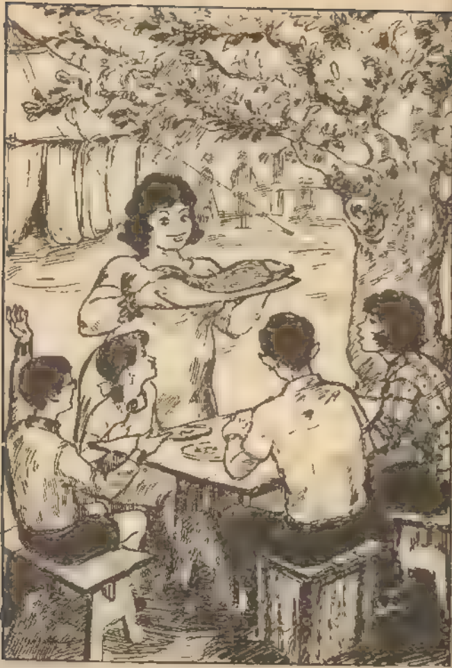
جلس الجميع في ظل شجرة ضخمة يأكلون السمك الذي أعدته لهم « تفيدة »

فرد " خالد " : إذن سوف ننتظرك أمام البيت الساعة الثامنة صباحاً لنبدأ رحلتنا .