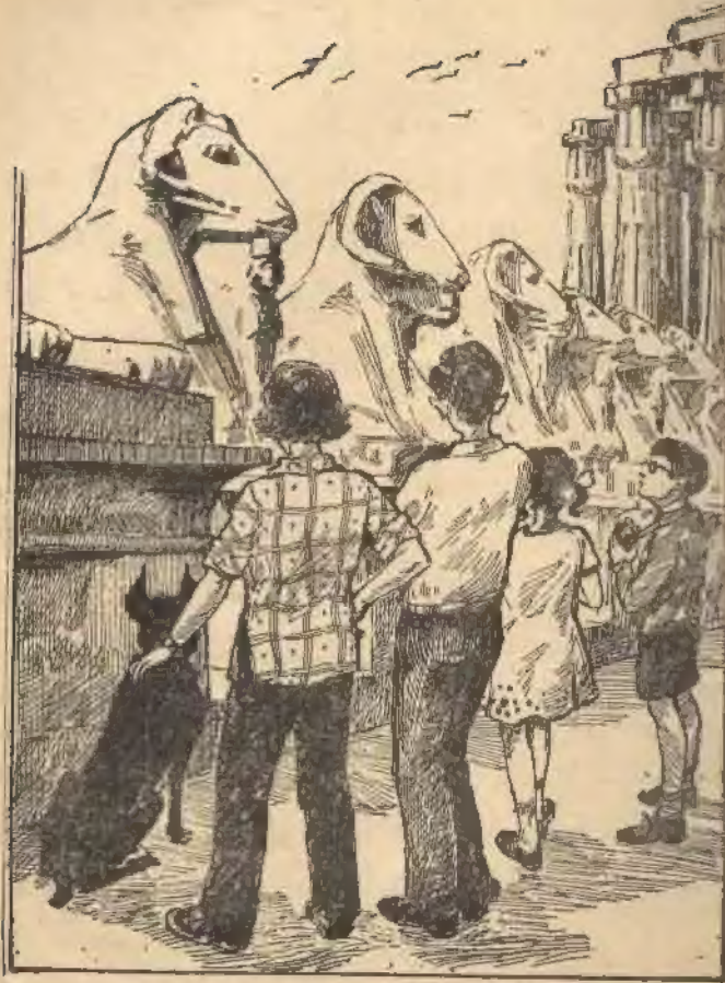
وقف المخبرون الأربعة وقد راعتهم عظمة الآثار المصرية |

الترفيه مثل الغناء والرقص وبعض الألعاب البهلوانية البسيطة | فقال " طارق " : إننى لم أشاهد مثل هذه الفرق فى حياتى .