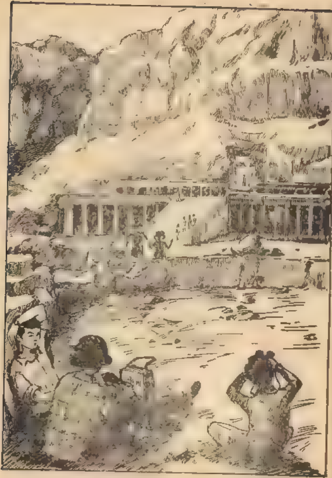
ومن بعيد بدت أعمدة معبد الملكة « حثبوت »

لم يلق "طارق" تشجيعاً من أحد . . فقد كان الجميع يشعرون بالتعب . . فأخذ يراقب السماء . ثم الجبل المشرف على الوادى . . ثم أخذ ينتقل بعينه بين المقابر . . وفجأة