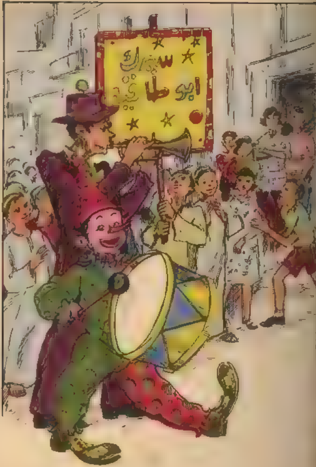
كان هناك موكب يتشده رجل يدق على طبله كبيرة

فقال "طارق" مستعظماً : لماذا يا "دادة" ؟ إنه نعم مستأنس ، غير ضار . ونحن نود أن نذهب غداً لمشاهدته . فهزّت "سنية" رأسها معترضة . . فقالت "مشيرة" أرجوكي يا "دادة" أن تسمحي لنا بالذهاب إلى السيرك غداً لكي نتفرج على الساحر الهندي والرجل الذي يلعب بالنار كانت "سنية" طيبة القلب . . فرق قلبها أمام إخ الأولاد وتوسلاتهم . فقالت : لا مانع هذه المرة فقط . ولكن بعد ذلك لن تذهبوا إلى السيرك . . والآن هيا بنا نتناول طه العشاء . لقد أعددت لكم فطيراً وعسلاً وقشدة .