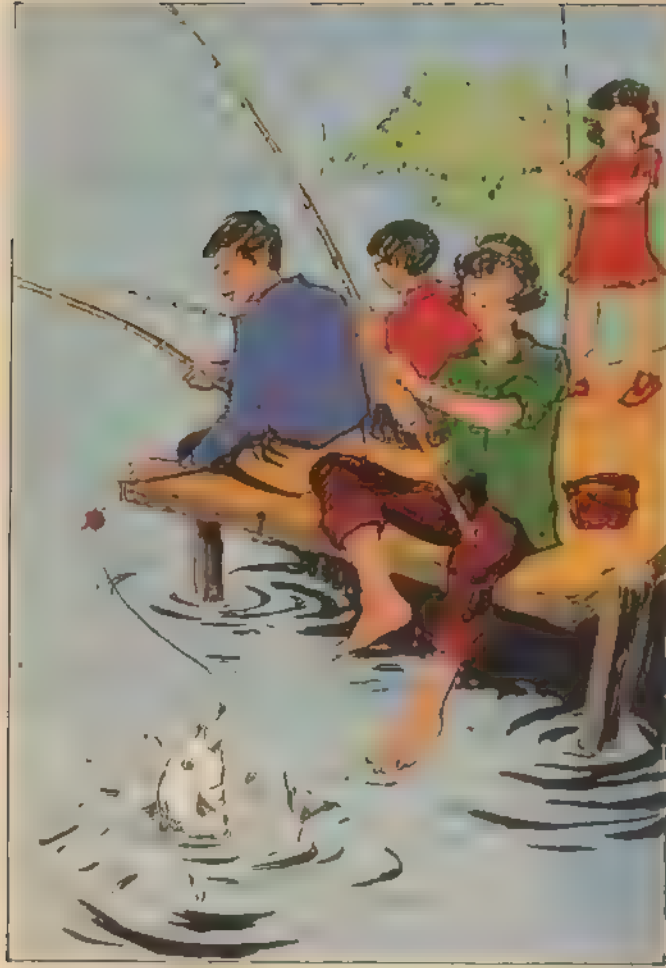
كان يوماً ممتعاً عمراً فيه صيداً وميراً

رمقه الأستاذ " عبد الغفار بنظرة ملؤها الغضب وقال : إن الصوت يأتي من هنا . من داخل هذا المنزل ! وتأكدوا كلهم أن أحداً قد أوعز للأستاذ " عبد الغفار" أنهم يخفون كلباً في المنزل . وإلا لما أصر كل هذا الإصرار . . ومن يكون هذا الموعز إلا " عطا " !! ولحسن الحظ توقف " فهد " عن النباح ولم يصدر عنه صوت آخر . . واعتنم الأولاد الفرصة وقال " بلية " : أين هذا الصوت ؟ . . إنني لا أسمع شيئاً . ورد " خالد " : وأنا كذلك لم أسمع شيئاً على الإطلاق . فقال الأستاذ " عبد الغفار " بصوت حازم : فليكن معلوماً للجميع أنني لا أسمع بدخول الكلاب إلى هذا المنزل . . وإذا عثرت على كلب هنا فسوف أقضي عليه . . وستكونون المسئولين عن موته . ثم خرج من الحجرة دون كلمة أخرى . وفي حجرة " بلية " . . أخذ الأصدقاء يفكرون . . كيف يتصرفون ؟ وبلا تردد قالت " فلفل " : سوف أعود إلى أسيوط . . إنني لا أستطيع التضحية بـ " فهد " . فرد " خالد " : ولكنك لا تستطيعين الذهاب إلى أسيوط بمفردك . . وسوف تضطر جميعاً إلى السفر . . وفي هذه