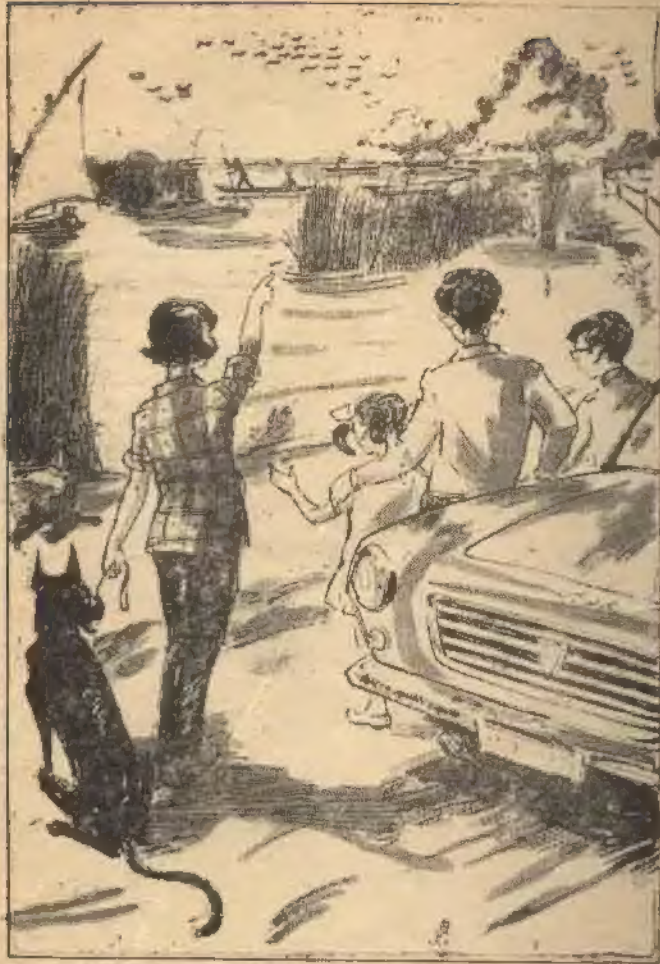
لأول مرة شاهد المحبرون الأربعة زوارق بحيرة المنزلة بشكلها غير المألوف

كان التعب قد استبد بهم جميعاً . فأغمض الواحد منهم بعد الآخر عينيه . . وراحوا في نوم عميق . . وساد الهدوء السيارة . .