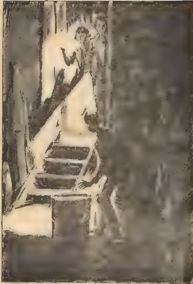
تجمرو و لخرة السفل .. و حوم جوالا فارة .. و بمض الأخشاب القديمة .. وقد فاحت منها رائحة الرطوبة والتراب

الداخل 7 بقفل فيه مفتاحه . فتتح "بلية" الباب ، فدخلت أشعة الشمس الدافئة ، وأطل "بلية" برأسه .. وتلفت يمينا ويساراً .. لم يكن هناك أثر لأحد .. فهمس : هيا جميعاً .. إن الطريق ضال ..