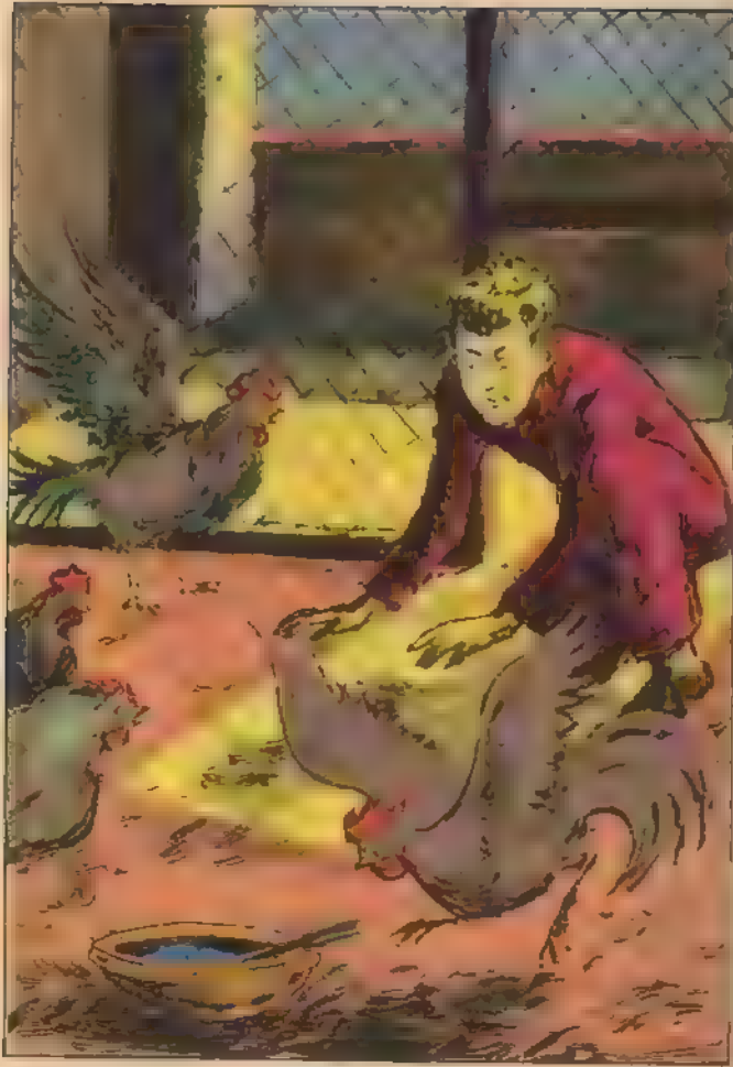
وأيقظ « بلي » أنه لا فتنة من لثقه بين هذه المواجن اسمها

يخرج من الحظيرة ووقف بجانب حجرة الفسيل محاولا الاستماع إلى ما يدور بداخلها ..