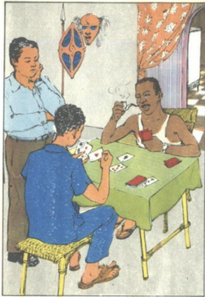
وجلس الصديقان بلعبان الكوتشينة و « تختخ » يراقبهما ليرى هل الكوتشينة ناقصة . .

إيبو : في الحقيقة إنني لم اشتريها بعد ، إنها ملك أحد رجال سفارة نيجيريا . . في القاهرة . وهو قريب ، وقد أعطيته مبلغاً من المال تحت الحساب لأنه مسافر في رحلة إلى فرنسا . . وصدقني أنني ندمت على دفع هذا المبلغ فلست أدرى متى تصلني نقود أخرى من أبي .