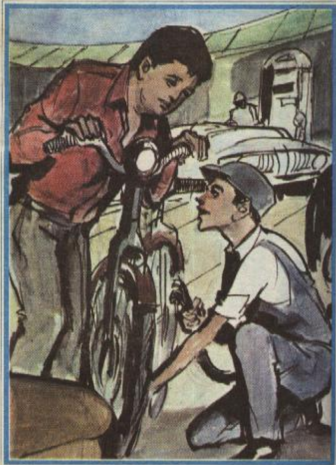
قال الولد - لتختخ : هل أستطيع أن أؤدي لك أية خدمة ؟

وجبه ليس غريباً عنه .. وأخذ ينظر إليه بامعانٍ في وسط ضجيج المحطة .. والتفت الولد فجأة وشاهد « تختخ » وهو ينظر إليه ، فابتسم وتقدم إليه قائلاً : ألا تعرفني ؟ .