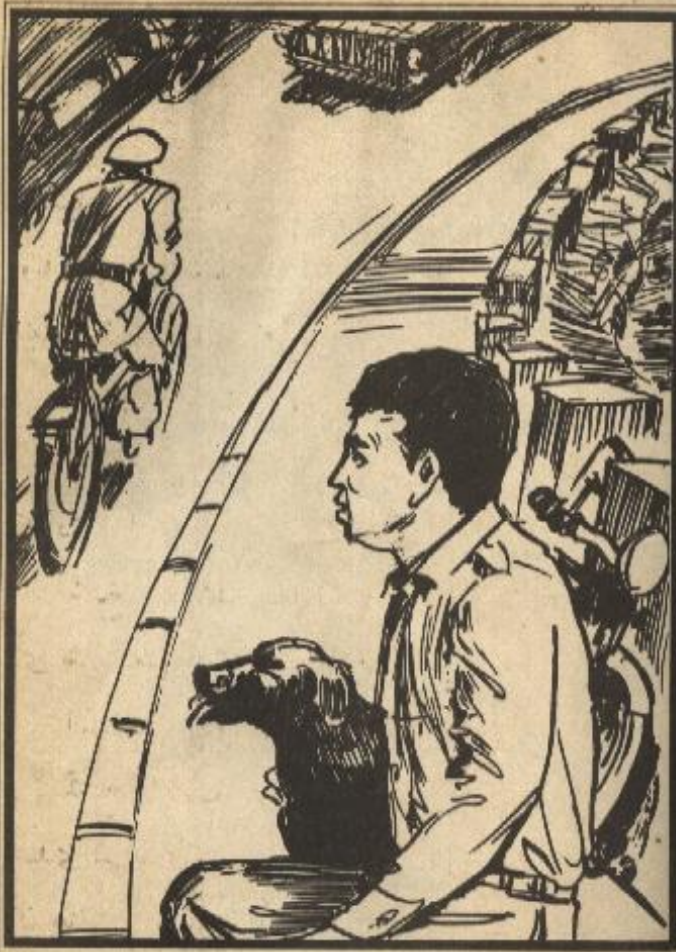
شاهد «تختخ» وهو جالس على الكورنيش الشاويش ، على « وهو يسرع بدراجته

إلى دراجته وسار خلف الشاويش .. ومضت مدة والشاويش مازال يسير .. وقرر «تختخ» أن يلحق به .. فقد يكون ذاهباً في مشكلة عادية لا علاقة لها بالسيارة المسروقة .. بعد لحظات لحق بالشاويش وناداه .. والتفت إليه الشاويش مدهوشاً .. ثم ركن بجوار الرصيف وسأله بحِدَّة : كيف عرفت ؟ .