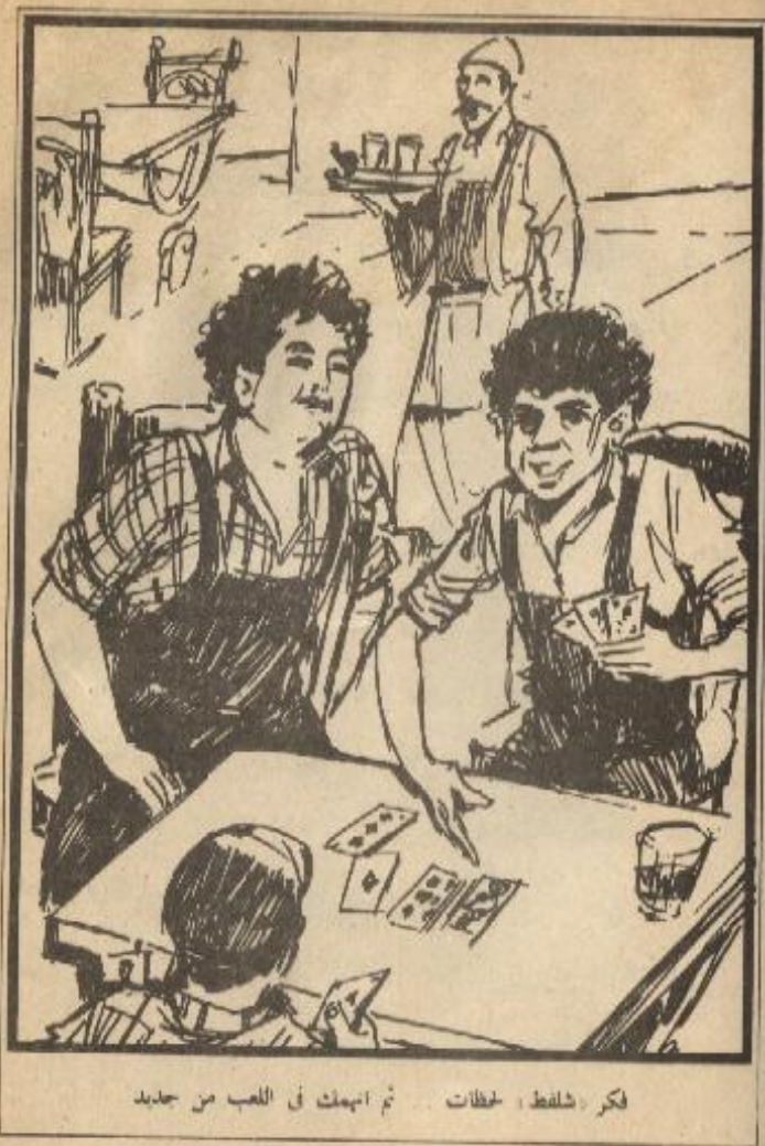
لكر « شلفط » لحظات .. ثم انتهت في اللعب من جديد

تختنخ : سأدخل إلى هذه الحارة للسؤال عنه .. بدعوى أنني قادم من محطة البنزين للبحث عنه