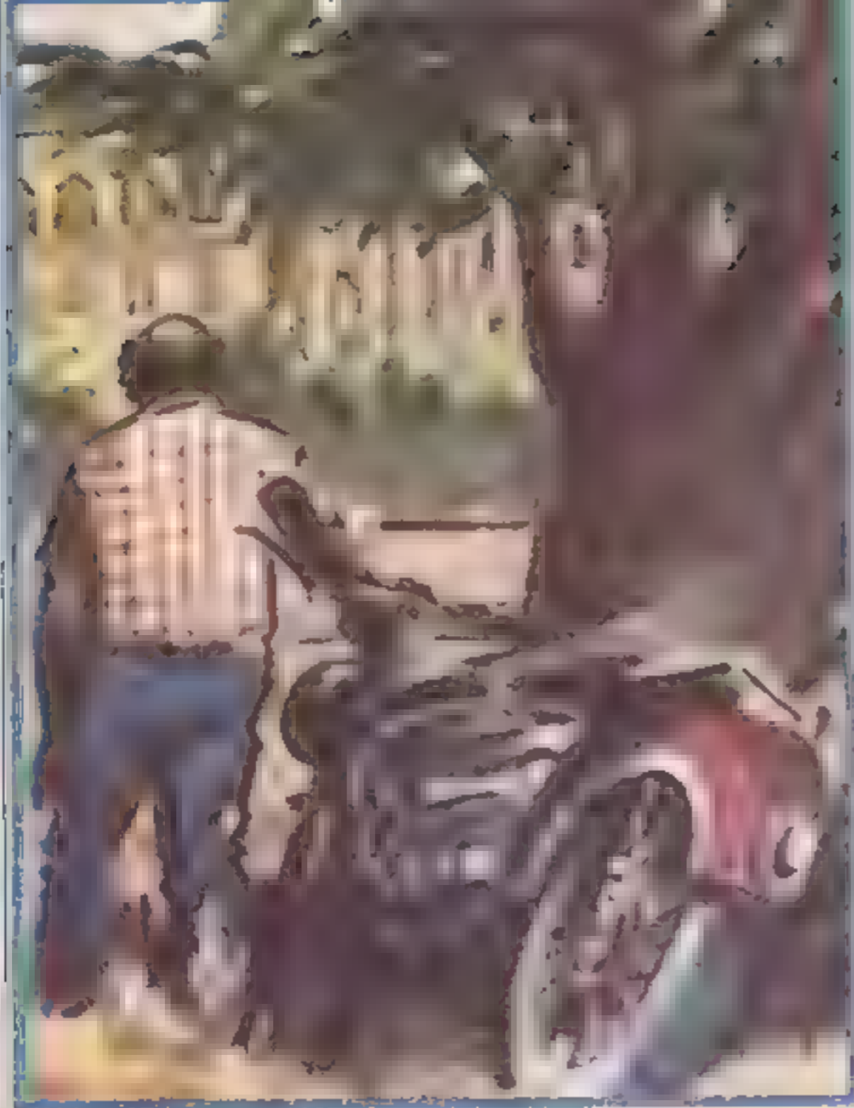
ترك الصور البدين دراجته الحارية وانعم إلى صديقه فى الفندق .

واستوقفتهم عند مدخل الفندق لوحة عنقت عليها صورة كبيرة لراقص أفريقي .. عارى الصدر .. يغطي بأقى جسده حلد نمر أرقط .. وعلى رأسه تاج من الريش الأبيض .. ويمسك فى يده رمحًا طويلًا .