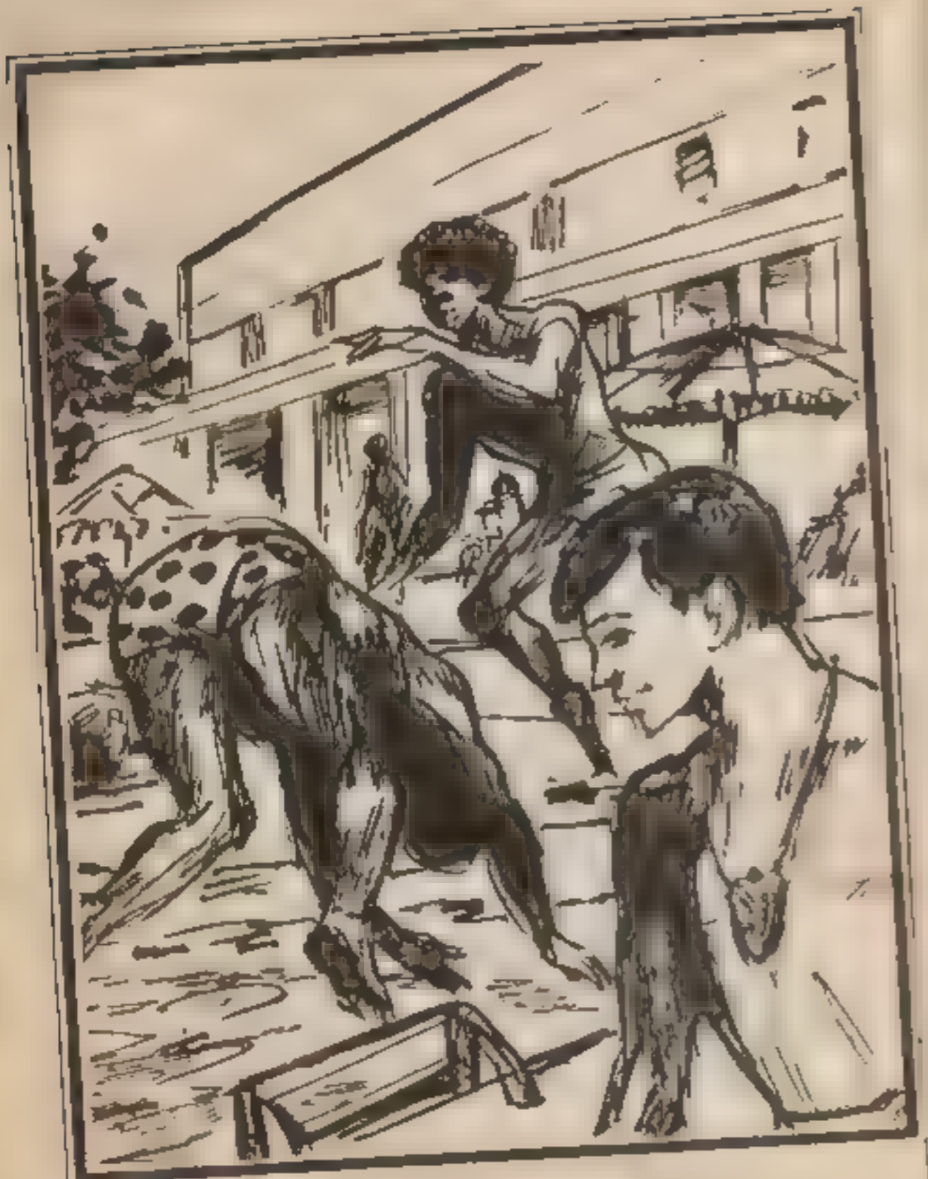
راهم « عامر » يقفرون إلى الماء . ويلومون حركات مهلوبة

وانته « عامر » إلى مصصة القصر العاني التي يريد ارتفاعها قليلا على عشرة أمتار ويبدأ في تسلق سلمها العمودي في خفة حتى يصل إلى المصصة ويحيل البصر من حوله . فتشيره روعة المداظر المحيطة به . رأى أمامه « فيلات » ومنايا حميلة تحيط بها حدائق عناء مسورة على حاشي طريق « الإسكندرية » . الذي يمتد ويتلوى عبر رمال الصحراء المترامية الأطراف ورأى عن يمينه مباني « القاهرة » وسط مساحة عريضة داكنة الخضرة . تحدها من الشرق . وعلى مرتفع من الأرض ، قلعة « صلاح الدين الأيوبي » تعلوها بواب وماذن مسجد « محمد علي » وأدر بصره عرناً