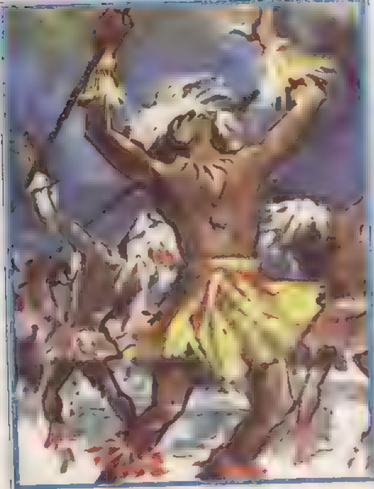
رسم كل رصاص مخرج من الرمش . وسده ربح هوسل .

ويسأله «مملوح» : وماهي فكرتك ؟ ولم يحبه «عامر» بل التفت إلى «عالية» قائلاً . أعتقد أن الحلبة العاحية مازالت معك !! وتمد «عالية» يدها إلى حقيبتها ، وتخرج منها كيس