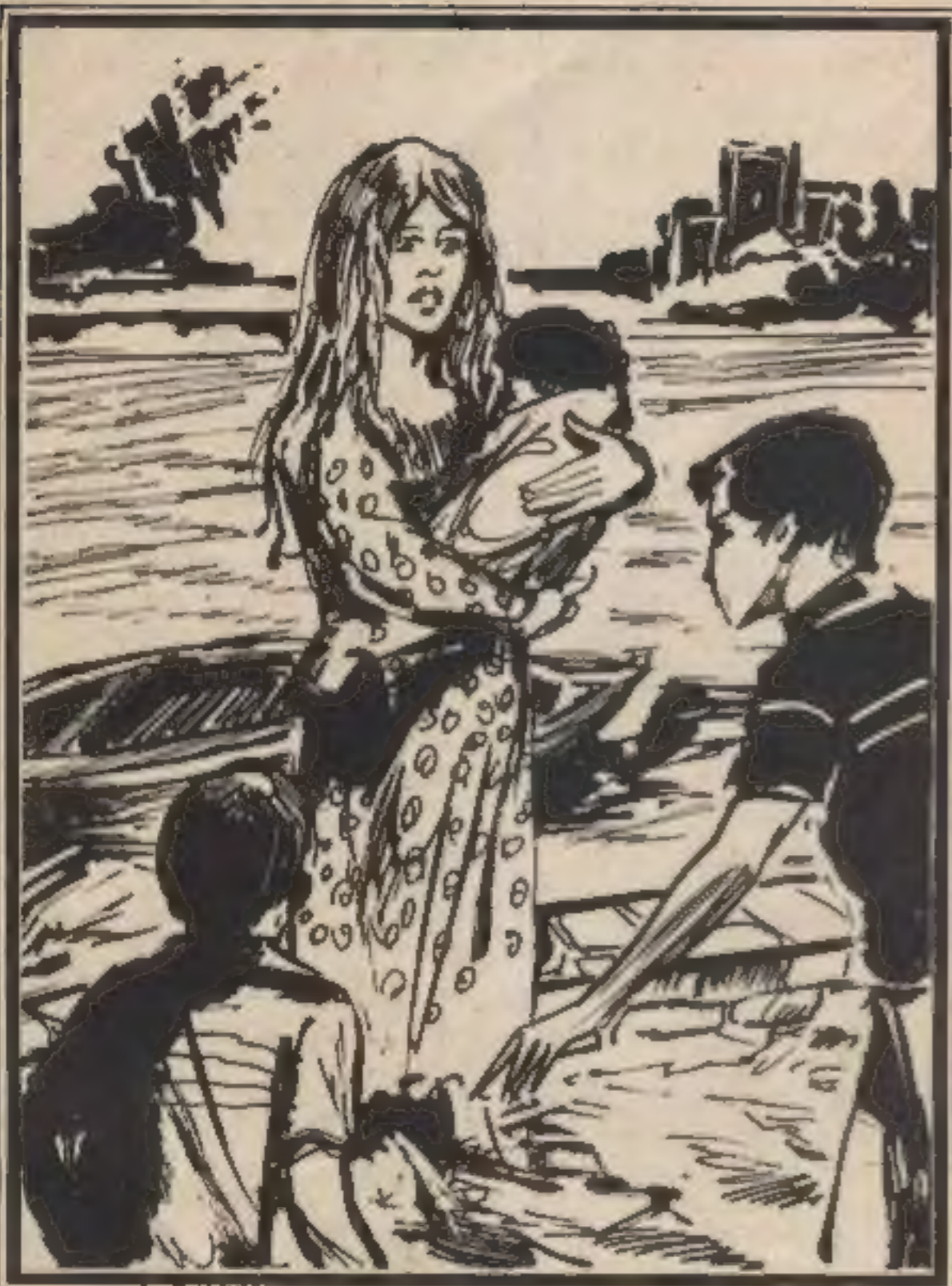
ولفت المرأة بشبابها المبتلة .. وقد نهلت مصللات من شعرها الأحمر

وكان « عامر » قد عاد مسرعاً من المنزل .. حاملاً بطانية من الصوف ، فأخذتها « عالية » ولقتها حول جسد المرأة التي شكرتها بابتسامة رقيقة .. ولكن « عالية » نظرت في تساؤل إلى المرأة ذات الشعر الأحمر والبشرة البيضاء وهي تقول في دهشة بعد أن لمحت وجه الطفل : الطفل أسود اللون !