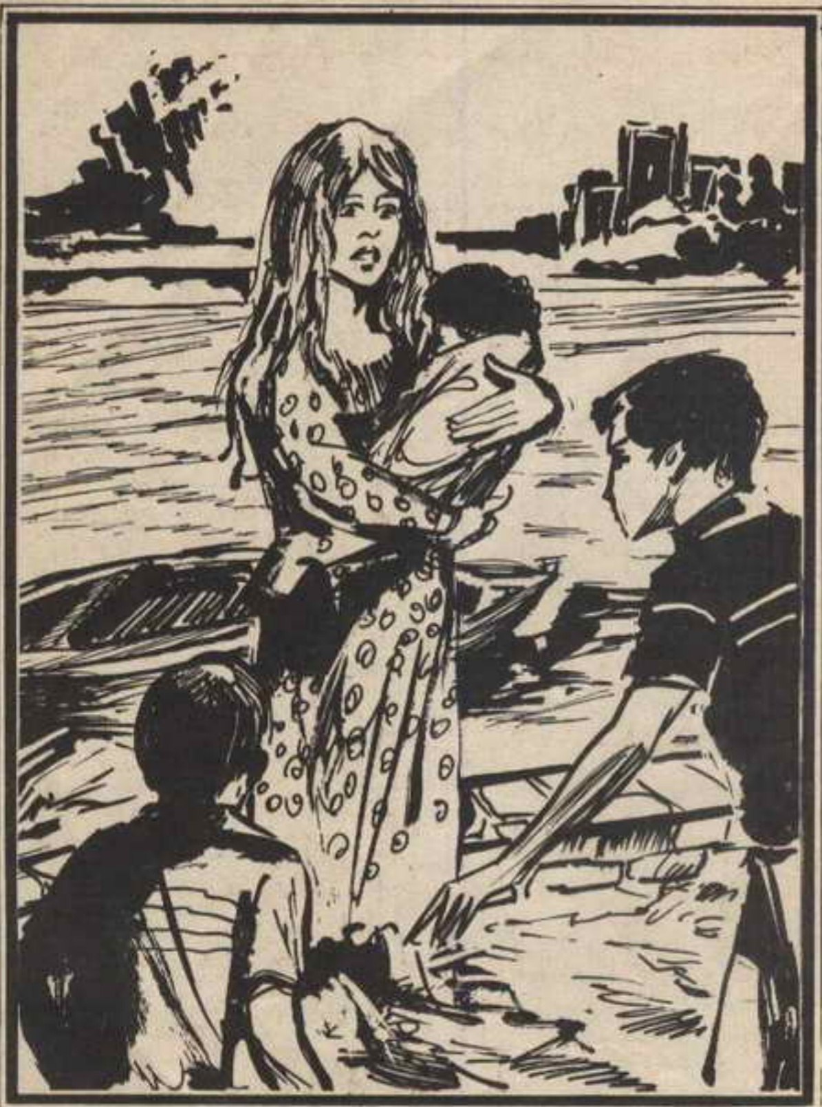
وقفت المرأة بثيابها المبتلة .. وقد نهلت عصلات من شعرها الأحمر

وكان « عامر » قد عاد مسرعاً من المنزل .. حاملاً بطانية من الصوف ، فأخذتها « عالية » ولفتها حول جسد المرأة التي شكرتها بابتسامة رقيقة .. ولكن « عالية » نظرت في تساؤل إلى المرأة ذات الشعر الأحمر والبشرة البيضاء وهي تقول في دهشة بعد أن لمحت وجه الطفل : الطفل أسود اللون !