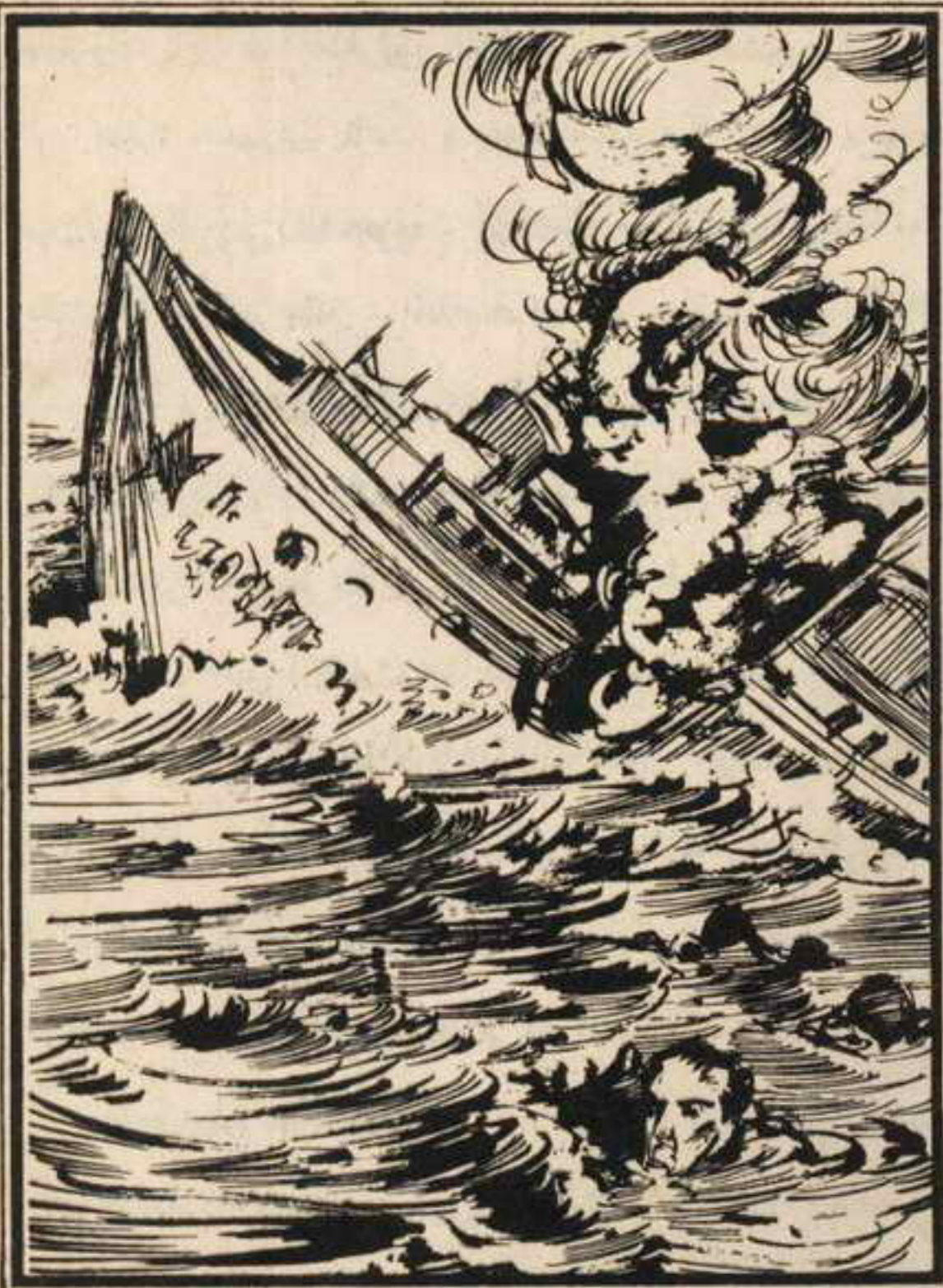
وفجأة دوى انفجار هائل في قلب السفينة .. وشاهدتها وهي تغوص في قاع البحر

وعلى بعد نحو ثلاثة كيلومترات تلاشت السفينة « النجمة الخضراء » ونجا بعض بحارتها وغرق بعضهم ، وعندما جاءت لجنة التحقيق أثبتت أن من بين الغرقى القبطان والضابط الثانى !