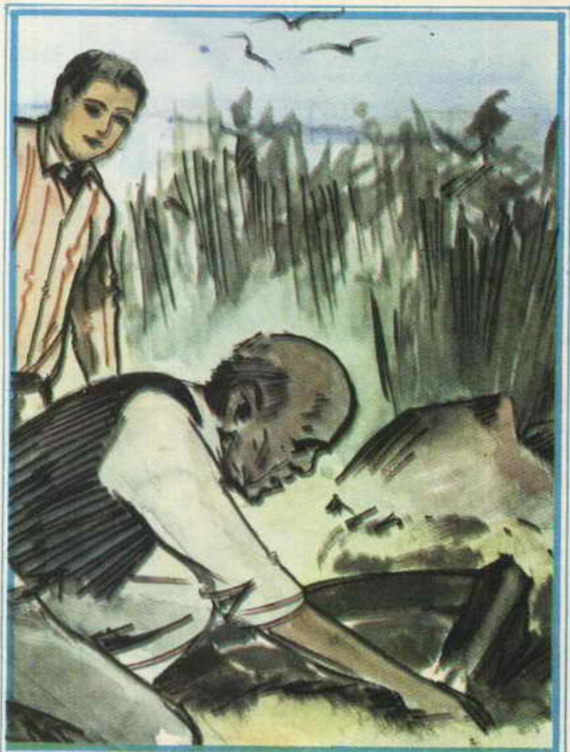
ولم تغض دقاتك حتى ظهرت مقدمة القارب ، أسرع ، ونحن ، بشارك ، عم سالم ، العمل .

واستعد هو والزملاء لقضاء ليلة هادئة ، ولكن أحلامهم تبددت ، فن إحدى النوافذ المفتوحة على الصالة اندفع حجر متوسط الحجم كالقذيفة ، وارتطم بأحد المقاعد ثم سقط على الأرض .