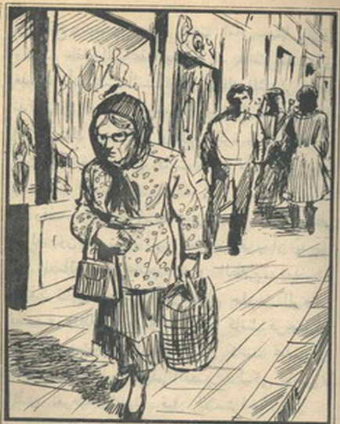
تبع «تختخ» السيدة العجوز حتى ولقت أمام السينا

الذى يتوقف على وجوده حل اللغز. تسلمت العجوز البريد، وخرجت فتبعها «تختخ» من بعيد، وعبر خلفها شارع الجلاء حيث يقع مبنى الأهرام، ثم سارت بجوار هيئة التليفونات فسار خلفها، ثم اجتازت شارع رمسيس ودخلت إلى شارع سوق التوفيقية، فأسرع «تختخ» يقترب منها حتى لا تضيع منه في زحام السوق، وأصبح على بعد خطوات منها وهي تسير في نشاط ظاهر، ثم توقفت عند باعة الفاكهة فاشتريت ما يلزمها، ثم واصلت السير، فسار يتبعها حتى وصلت إلى شارع توفيق، واجتازت شارع ٢٦ يوليو، ودخلت إلى شارع طلعت حرب، وكانت حركة المواصلات والزحام على أشدها، ولكن «تختخ» استطاع أن يظل قريباً منها دون أن تشعر به.