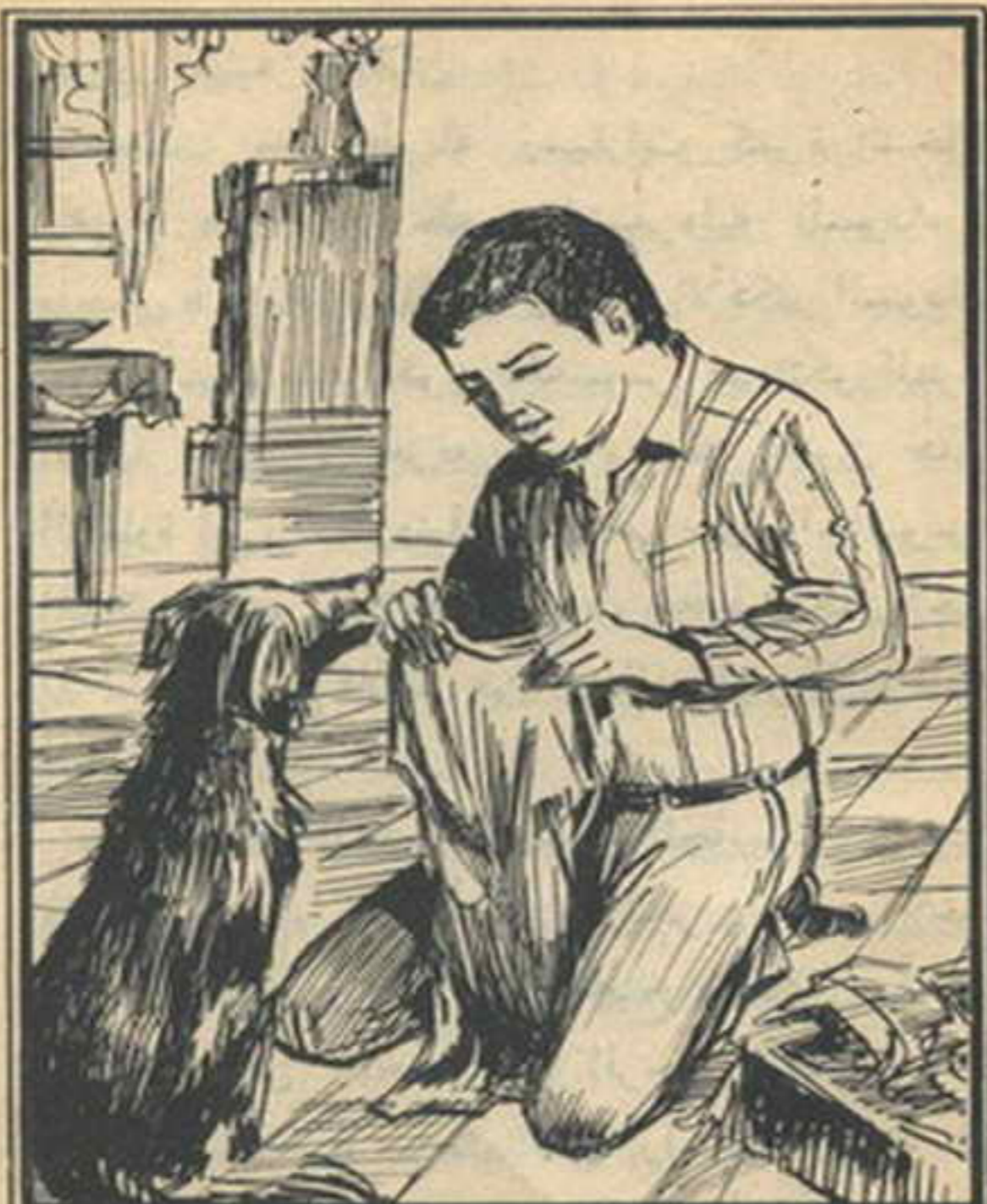
وقدم «تختخ» «زنجر» الملابس الداخلية للجاسوس فقد يستطيع التعرف عليه من راتحتها

أحد ليشتبه فيهم .. قال «تختخ» للمفتش وهم يقفون بعيداً : « أقترح أن أدخل أنا و« زنجر » إلى الجراج ونتجول أو نختفي في إحدى السيارات الواقفة فمن الأفضل أن يكون أحدنا قريباً من الجاسوس ..»