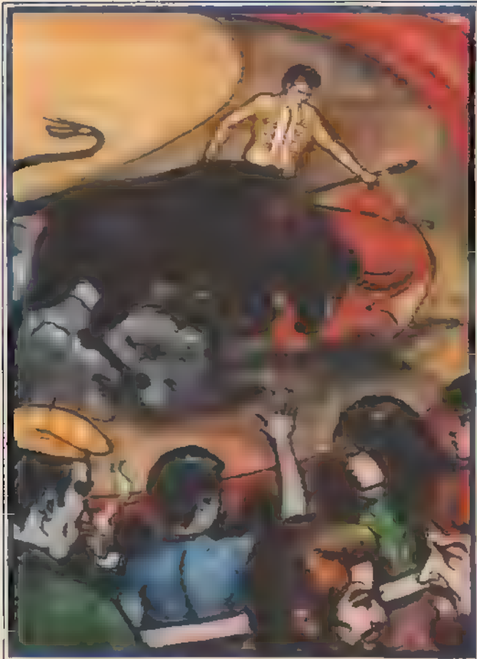
رؤساء الأصقاع (الماتادور) وهو يجهز على الثور الجريح

له ، وسوف يقوده إلى « البارون » عقب المباراة . وصاحت « أروي » وهي تطالع برنامج الحفل : سوف نشهد « الماتادور » العظيم « الكوردوبيث » !! والتفت إليها المغامرون الثلاثة في دهشة . فأوضح « إبراهيم » قائلاً : « الماتادور » هو مصارع الثيران ، و« الكوردوبيث » تعني « القرطبي » نسبة إلى مدينة « قرطبة » الأندلسية ، ويسمونها الآن « كوردوبيا » . وأشار مساعد « مانويل » إلى حجرة صغيرة في أحد عمارات المبنى وهو يقول : هذه غرفة « الكوردوبيث » . وتعلق « عامر » بذراعه وقال في رجاء : أريد أن أشاهد المصارع العظيم . وفكر الرجل لحظة ثم قال : أنا أيضًا تسعدني مقابلاته ، فهو بطل كبير محبوب . وقال « إبراهيم » وهم يتجهون إلى الغرفة الصغيرة : مصارعة الثيران رياضة قديمة في أسبانيا . . وتعد من