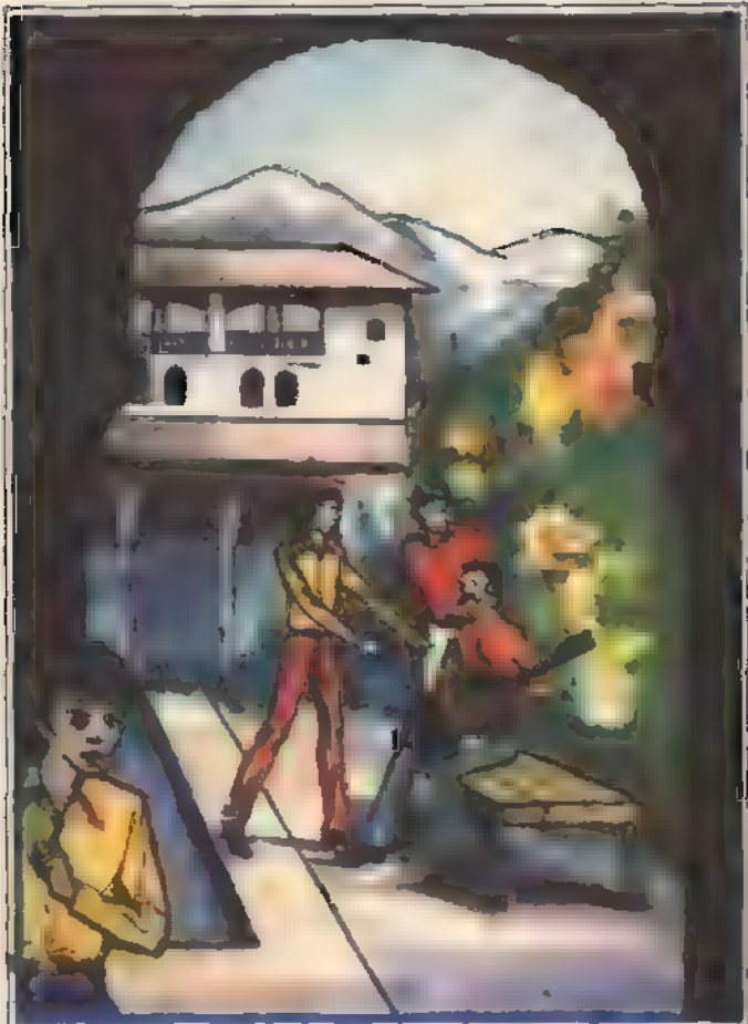
والعرب ، الفوسو ، وزينة من ، حوسيه ، اجالس على الدكة الحشيه وحاول احد صحتوق الختيار سه

وهتف «تريفو» وقد أعجبه اسم الأكلة : «شلولو» !! اسمها يغري بأكلها . . . كيف يعدونها؟ وأجاب العميد «ممدوح» : هي أكلة لذيدة يعدونها من مسحوق أوراق نبات الملوخية الجافة . . . مع طماطم وبصل وعصير ليمون وشطة . . . تُقلَّب جميعها في ماء بارد . . . وتؤكل مع خبز «شمسي» طري .