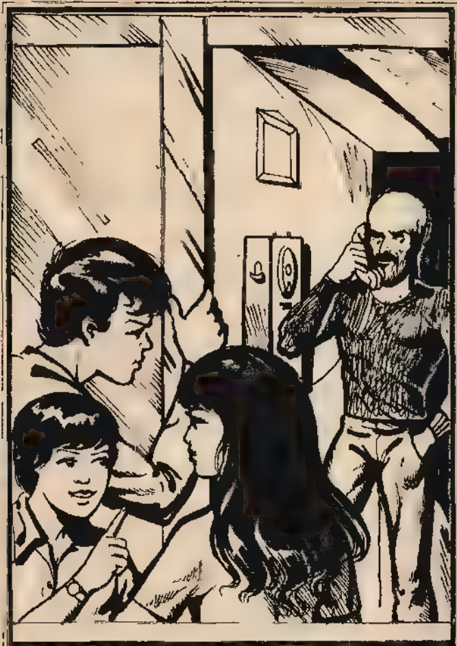
وشاهد المغامرون الثلاثة «سبيرو» وهو يتحدث في الهاتفون . .

واتجه العميد «سبيرو» ناحية كشك الصحف ، وتحدث مع العميد «مانويل» وهو يتظاهر بتصفح بعض المجلات المعروضة - خشية أن يكون هناك من يراقب المكان من رجال العصابة - ثم عاد إلى «الكافيتيريا» بعد شراء صحيفة .