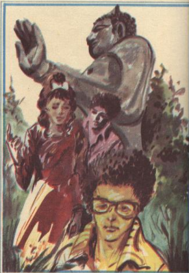
قال «محسن» : يد النبال هي الاختلاف الوحيد في السرا

في نفس اللحظة صاحت « هادية » : عنتر .. عنتر .. تعال هنا ! وخفض الكلب الذكي رأسه .. وأنى سريعاً مسكاً بين أسنانه قطعة من الورق ، لم يلاحظ وجودها أحد منهم .. وأخذتها هادية منه ، وبسطتها أمام شقيقها ، وكم كانت مفاجأتهم مذهلة .. فلم تكن الورقة التي عثر عليها « عنتر » إلا خريطة أخرى ، تحمل نفس طابع الخرائط السابقة !