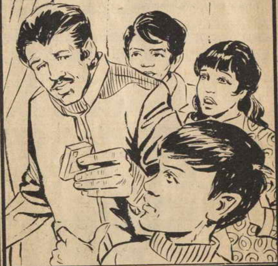
قال هذا وأخرج من جيبه علبة صغيرة ظنّها المغامرون علبة كبريت

عارف : « فوجل » يرتاب فينا ولا شك ! خصوصاً بعد اختفاء السلاح السرى ! . . . وقد يجنّد عملاءه بمجرد وصوله