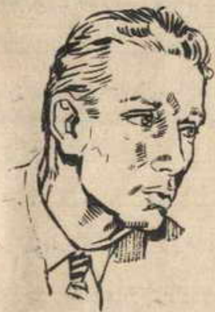
الهر « فوجل »

أصبح المغامرون في حيرة شديدة أمام ما يدور حولهم من أحداث . إنهم لا يجدون لها تفسيراً مقبولاً ، طالما أن « ممدوح » يخفى عنهم الحقيقة ! . لماذا كل هذا التكتّم ؟ لا جدال في أنه مشترك في عملية على أعلى