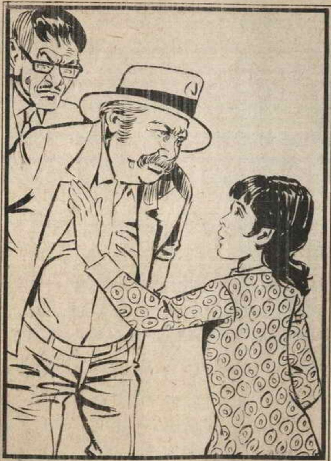
تلفتت «عالية» حوفا وآثار الدهشة البالغة تعلق وجهها البريء !

كغيرها من الناس . تنتظر دورها للحصول على فنجان من الشاي ! ! . . . ولا شأن لها بهما !