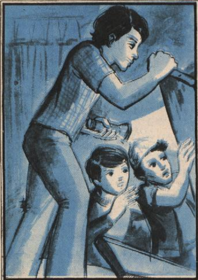
وإذا بأحد الألواح العريضة يتزلق ، وتظهر من ورائه فجوة مظلمة ..

وقف المغامرون وكانّ على رؤوسهم الطير ، يحدقون في هذه الفجوة .. التي سوف تقودهم إلى المجهول ! .. إلى أن هس « عامر » بصوت مرتعش : لقد وجدناه ! ! .. من كان يظن أن هذا المكان العالى يخفى وراءه باباً ؟ ! .. خالد : هيا بنا يا « عامر » لنرى إلى أين يقودنا هذا الباب الحقيقى . . .