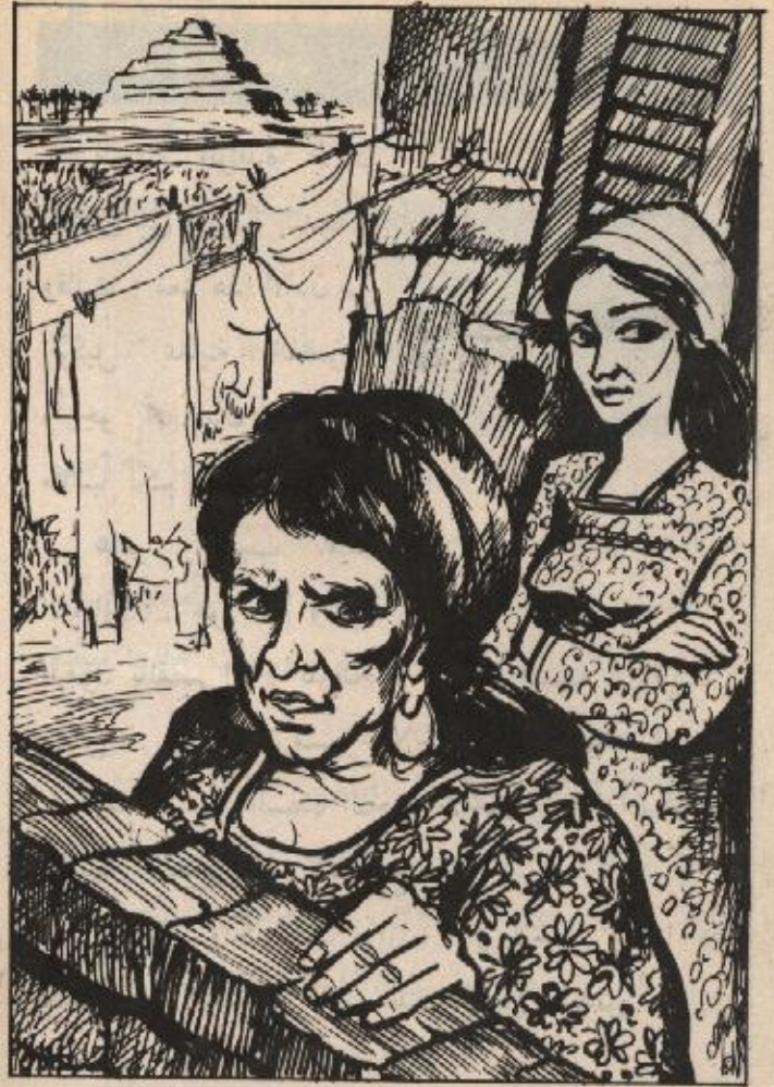
ظهرت أمامهم سيدة عجوز قصيرة بدينة ووقفت خلفها سيدة أخرى .

أخذت السيدة البدينة ، وكأنها لم تكن تتوقع ذلك ، وقالت : حسناً .. ولكن ابني ليس موجوداً الآن ! .. لقد نبهت عليّ بالألا أسمع لأحد برؤية القصر ! وقال لي : إن أحداً لا يفكر في الحصول على هذا المكان ! .. السيد النحيلة : لم يأت أحد من قبل لمشاهدته .. أوشرائه .. أو استجاره ! ! .. السيدة البدينة : لا أدري إذا كان في استطاعتي أن أسمح لكم بالدخول ! .. عامر : وهل قطعنا هذا المشوار الطويل .. لتقولاً لنا إن الدخول ممنوع ؟ ! .. عارف : ونحشى أن يصيبكما ضرر بليغ ، إذا علم أصحاب المنزل بهذه الواقعة ! .. عالية : إنهم سوف يخسرون مبلغاً كبيراً من المال ! .. خالد : وما علاقة ابنك بهذا الموضوع ؟ وبعد مداولة هامسة قصيرة بين السيدتين ، قالت البدينة :