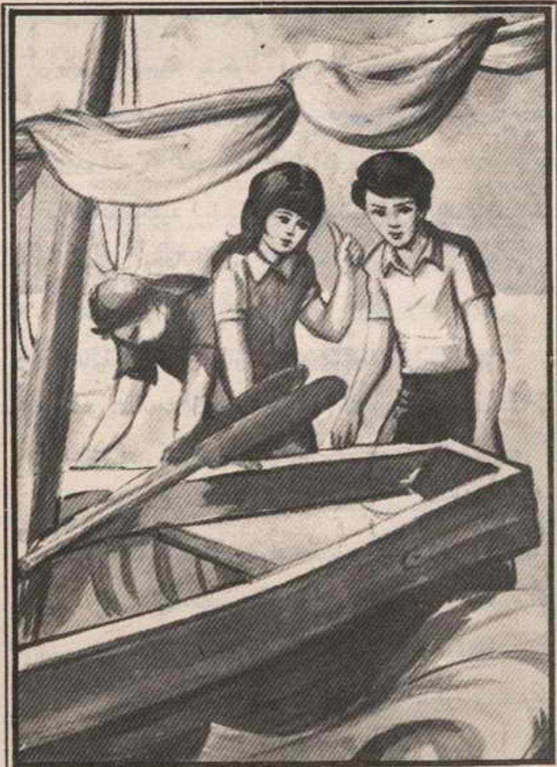
أكتشف «روميل» قارباً يتوارى في ظل الصخرة .

أسرعت إليه «عالية» وما كادت ترى سبب نجاحه المتواصل ، حتى نادى على إخوتها : تعالوا انظروا ماذا اكتشفه «روميل» ؟ ! ..